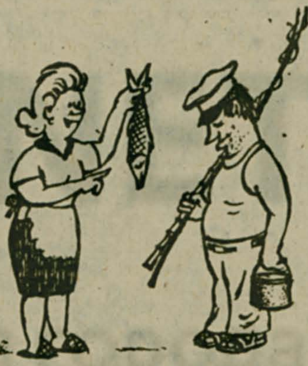
— Почему сегодня ловил?

— За что? — Вы ехали под мягким вагоном. *** — Встретить жену мне не удалось. Когда я подошел к поезду, ее не было. Я подозреваю, что она со вчерашнего дня уже дома. *** В Шотландии. — Сколько стоит телеграмма? — Каждое слово — два пенса. Подпись — бесплатно. Шотландец пишет: Встречай. Прибывающий в воскресенье десятым поездом твой любящий муж Ричард. *** В автошколе. — Я вас прекрасно понял. Вот только скажите, если кончится бензин, а машина будет продолжать ехать, это не повредит мотору? *** Пассажирка надоела капитану своими вопросами. Наконец она спросила: — А сколько отсюда до земли? — Всего 4 км, мадам. — Справа или слева? — Под нами. *** В книжном магазине. — У вас есть что-нибудь почитать в дороге? — Вам что-нибудь легкое? — Неважно, я на машине.