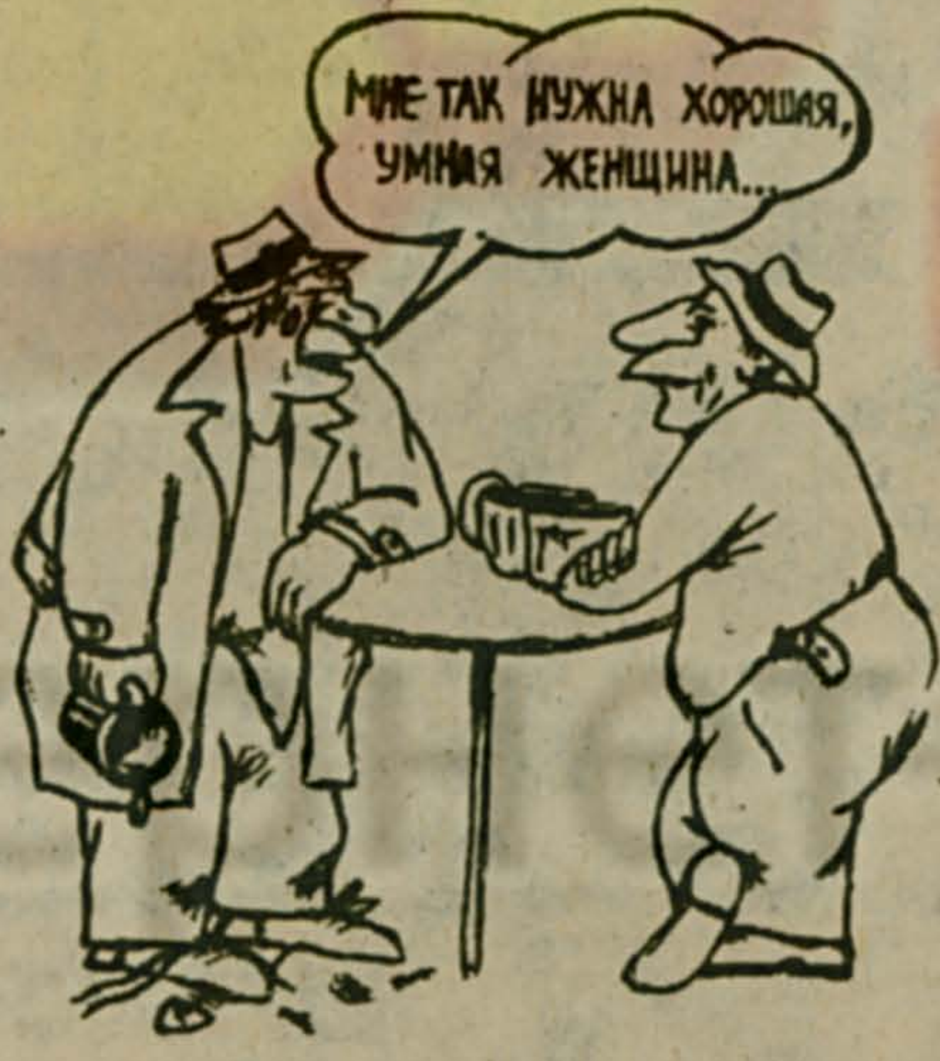
МНЕ ТАК НУЖНА ХОРОШАЯ, УМНАЯ ЖЕНЩИНА...

...В том, что ревешь, поверь, нет толка... ...Пусть облысею от любви!... ...Кого любил, то — пройденный этап... Александр ШАГАЛ