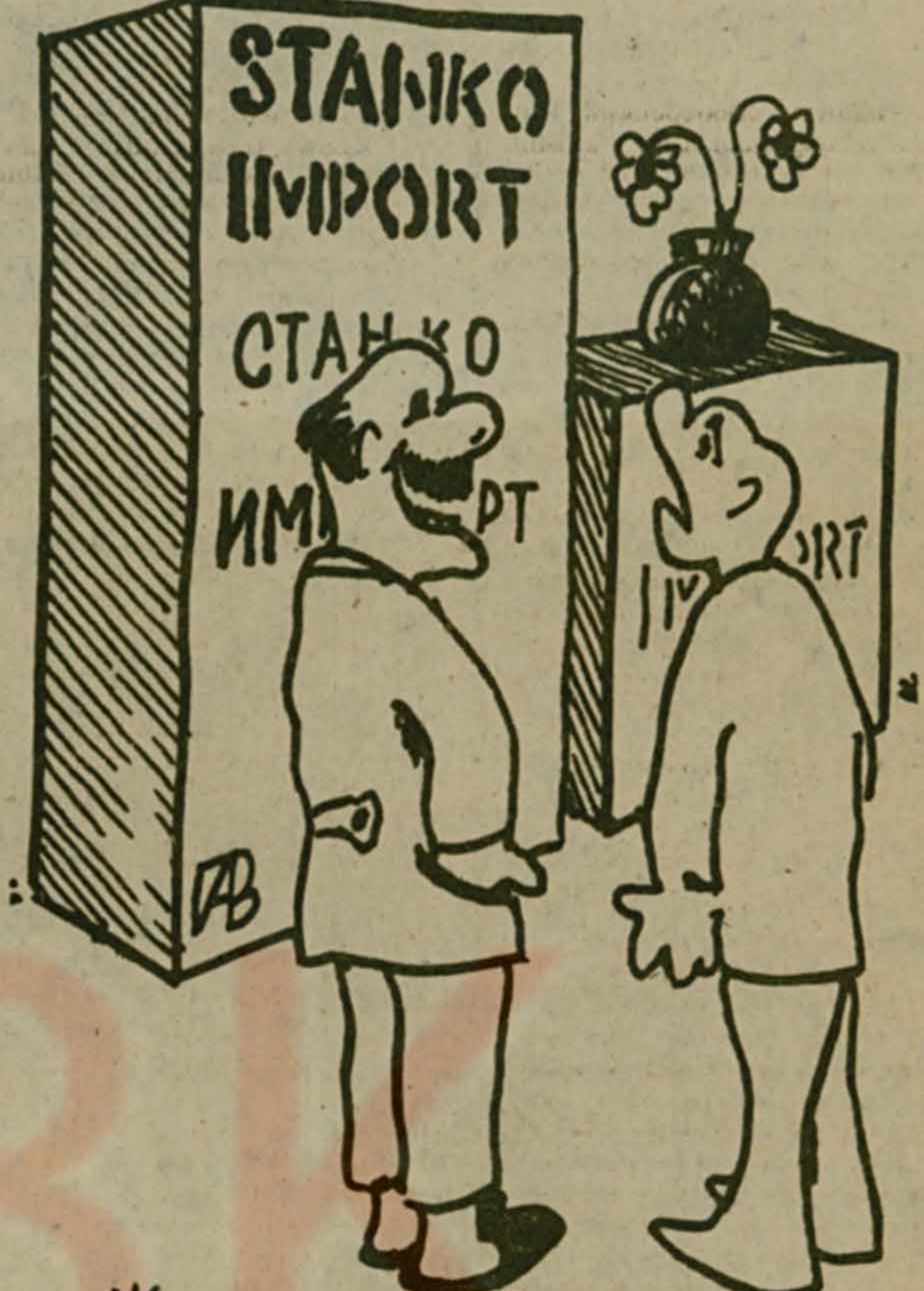
— ЖЕНА ДАВНО ПРОСИЛА ИМПОРТНУЮ МЕБЕЛЬ.

● Каждый ветер начинает с того, что поднимает пыль. ● Рак получил дружеское приглашение на кружку пива. ● Сколько вина можно купить на сэкономленные деньги, если отучить себя от курения! ● Мечта бескрылых — стать важной птицей. ● Поэтесса пустила слезу десяти тысячным тиражом. ● Ликвидировал разницу между умственным и физическим трудом — перестал думать. ● И на Пегасах порой гарцуют всадники без головы. ● Тайна летающих тарелок лучше всего познается в неблагоприятных семьях.