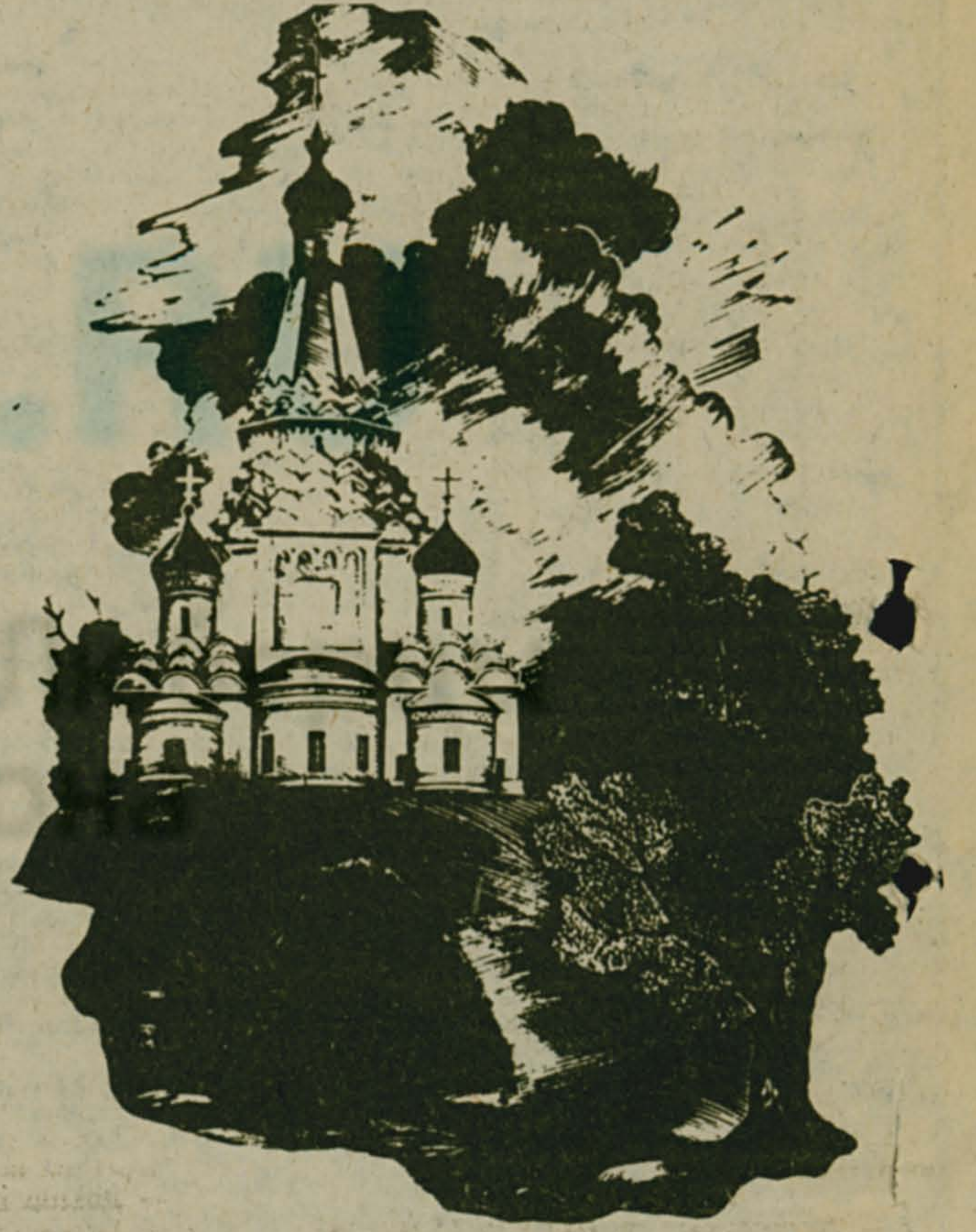
На снимке: храм Преображения в селе Остров. С линогравюры заслуженного работника культуры Российской Федерации Г. П. Воликова.