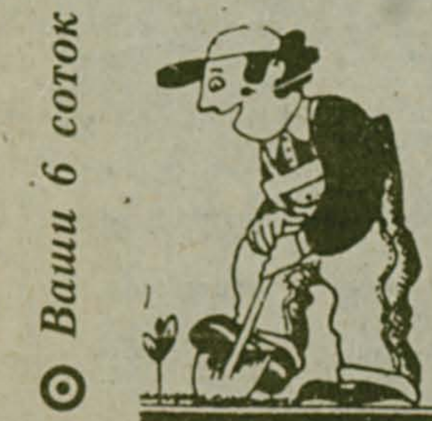
Ваши 6 соток