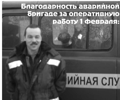
Благодарность аварийной бригаде за оперативную работу 1 февраля: