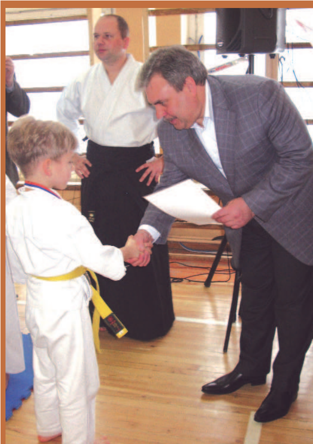
7-е Красковское Открытое личное первенство по традиционному карате состоялось 14 февраля в гимназии № 56.

Администрация, Совет депутатов и Совет ветеранов городского поселения Красково