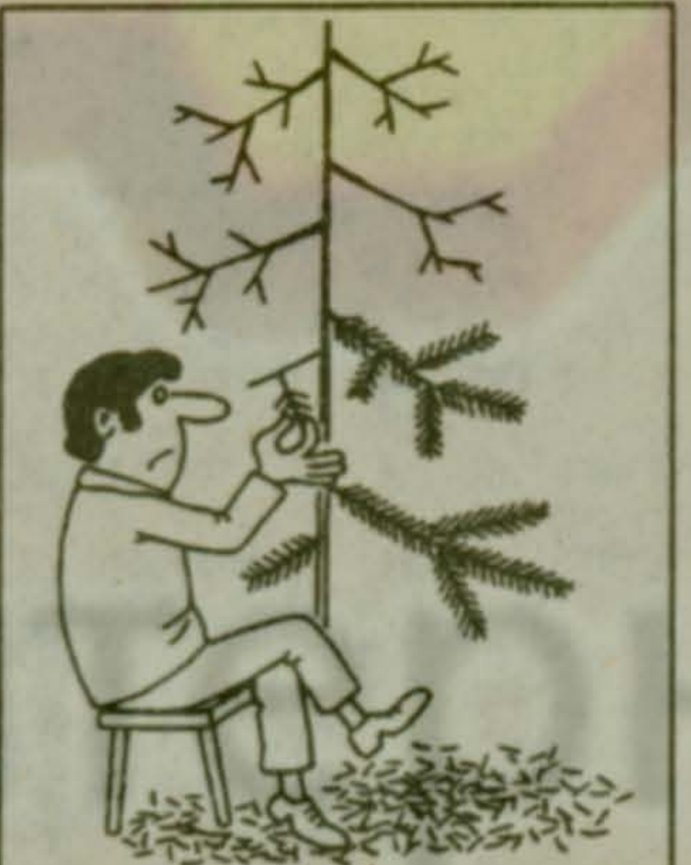
Любит... не любит...

мало тревог и разлук. Но сумели побороть все невзгоды, сохранили нежность чувств навсегда. Живут не в роскоши. Однако не печалются и не стареют душой.