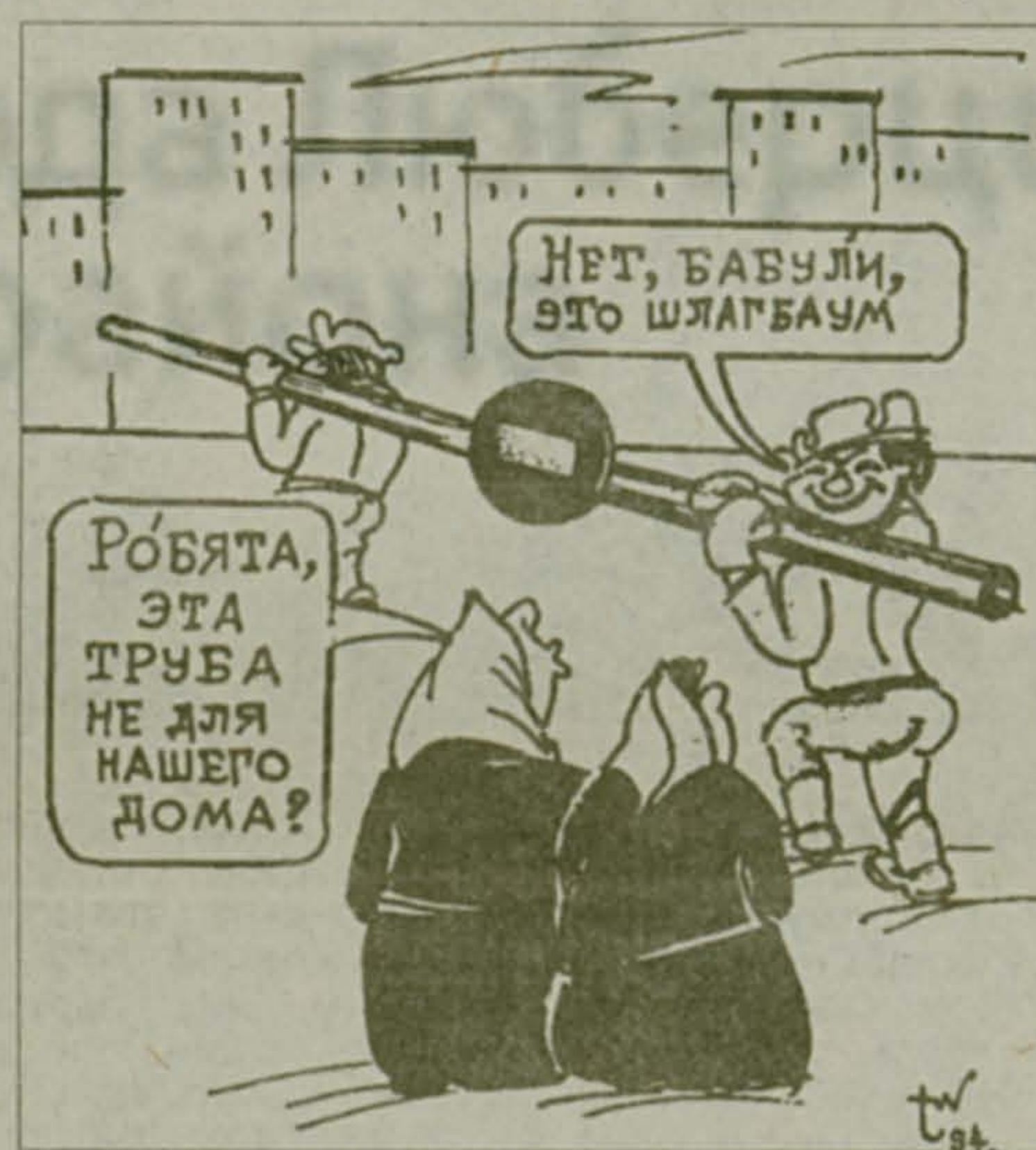
Рис. Владимира Токарева

Редакция обратилась к специалистам отдела за защитой прав потребителей при администрации района с просьбой прокомментировать письмо читательницы. Ниже публикуем ответ.