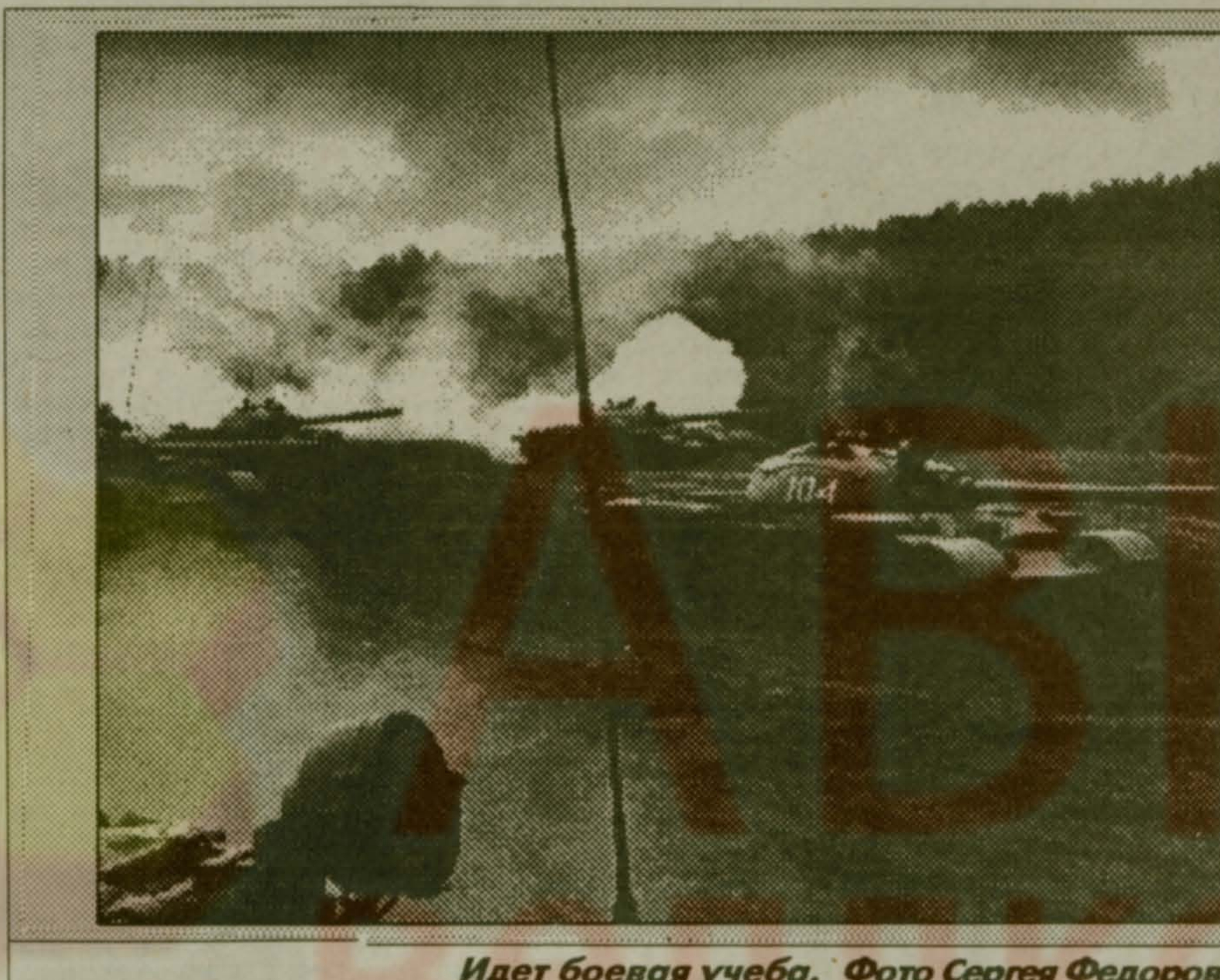
Идет боевая учеба.

Николай КАЛМЫКОВ, полковник запаса, контр. «Люберецкой газеты»