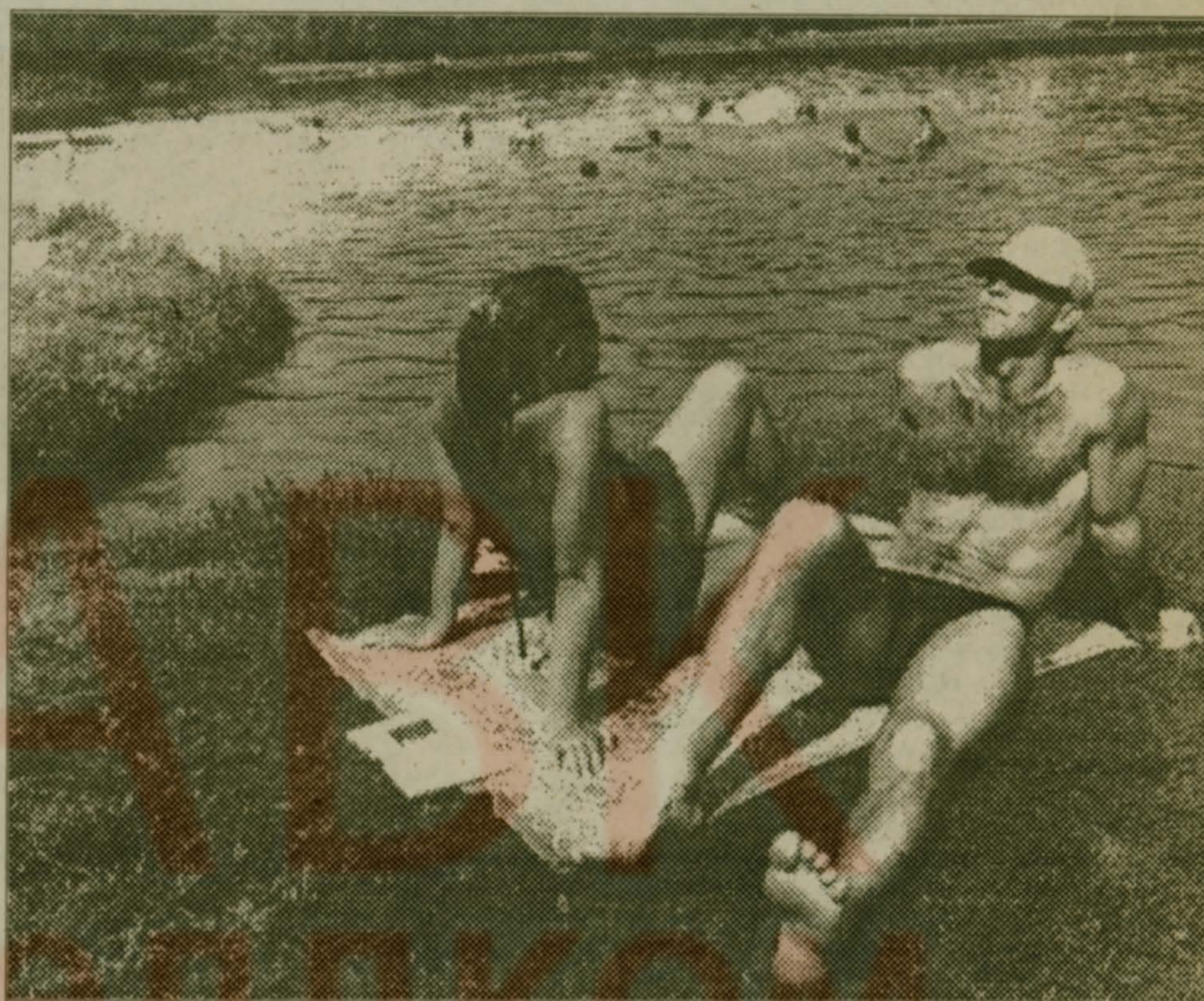
На Наташинских прудах.