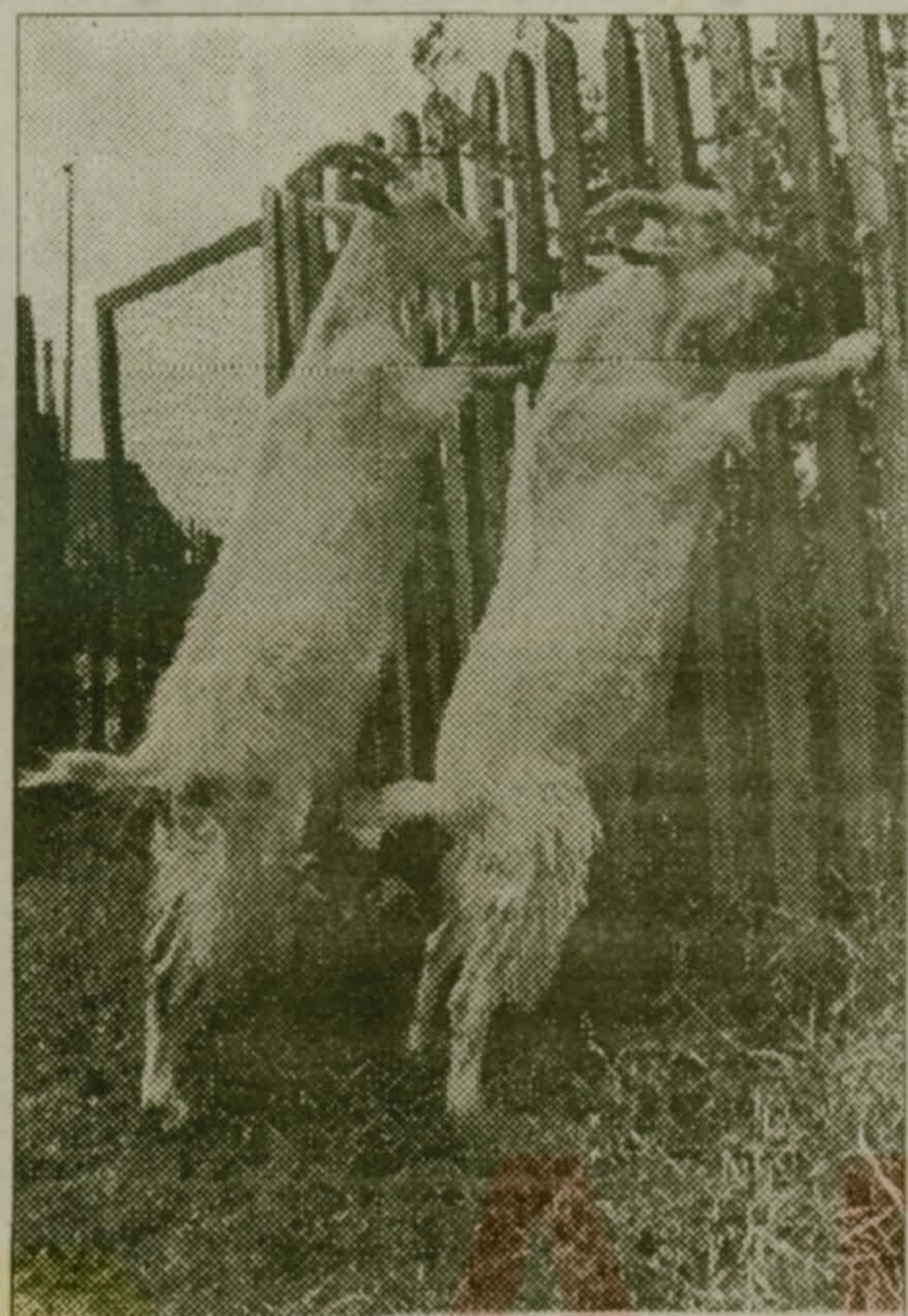
Хозяев не видать?

Кооп. «Роса» ликвидирован. Претензии принимаются до 2.10.95 г. Тел. 558-67-27