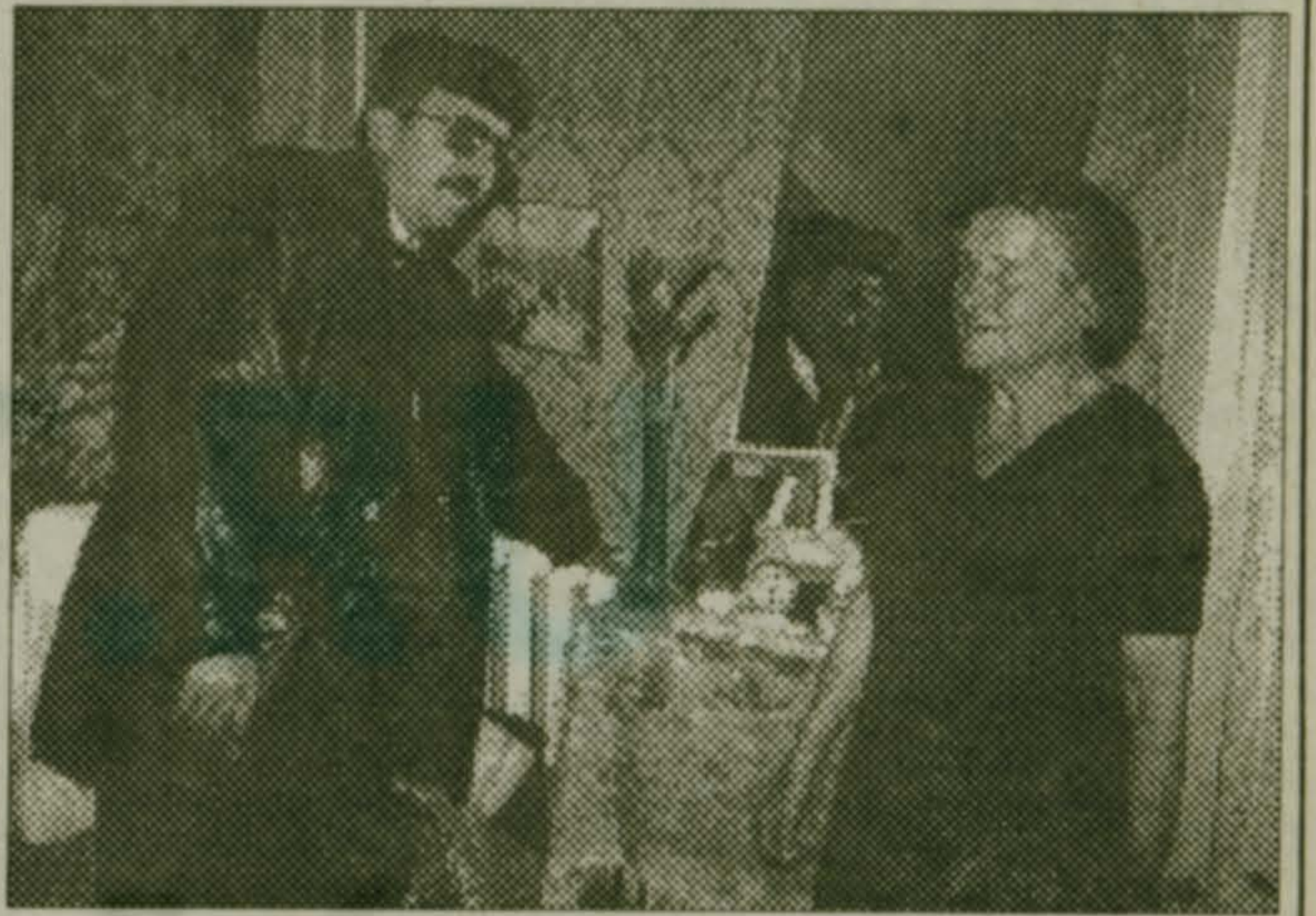
Районная избирательная комиссия

Режим работы - ежедневно с 10.00 до 18.00, кроме субботы и воскресенья.