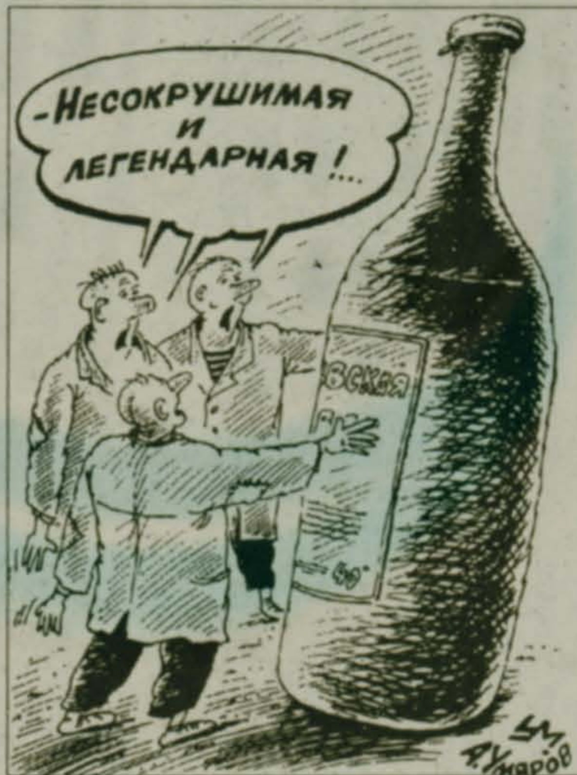
Рис. А. Умарова

Беседовал Александр ГОЛОВЕНКО «Правда России», № 29 (с некоторыми сокращениями).