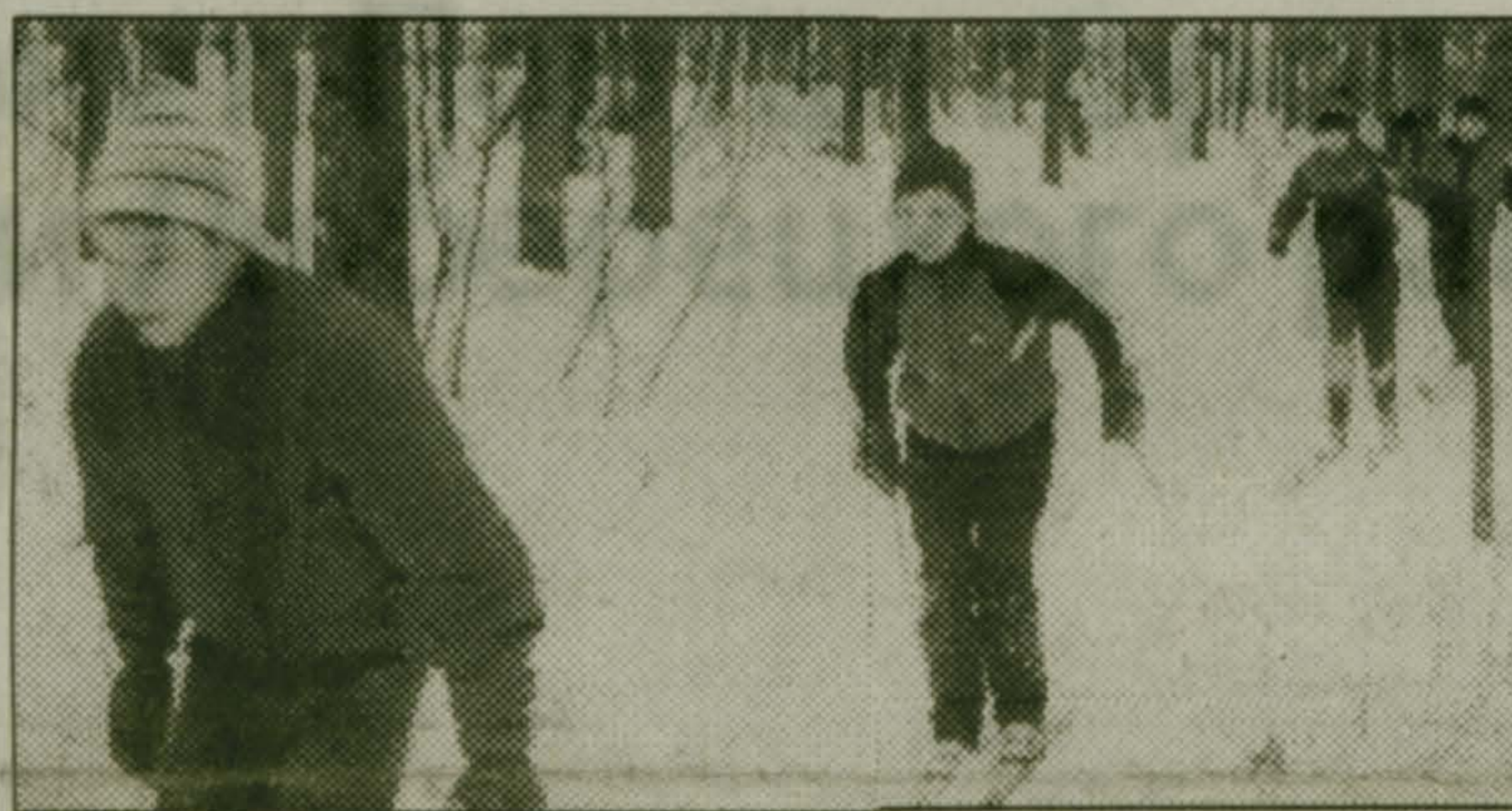
Уроки на воздухе