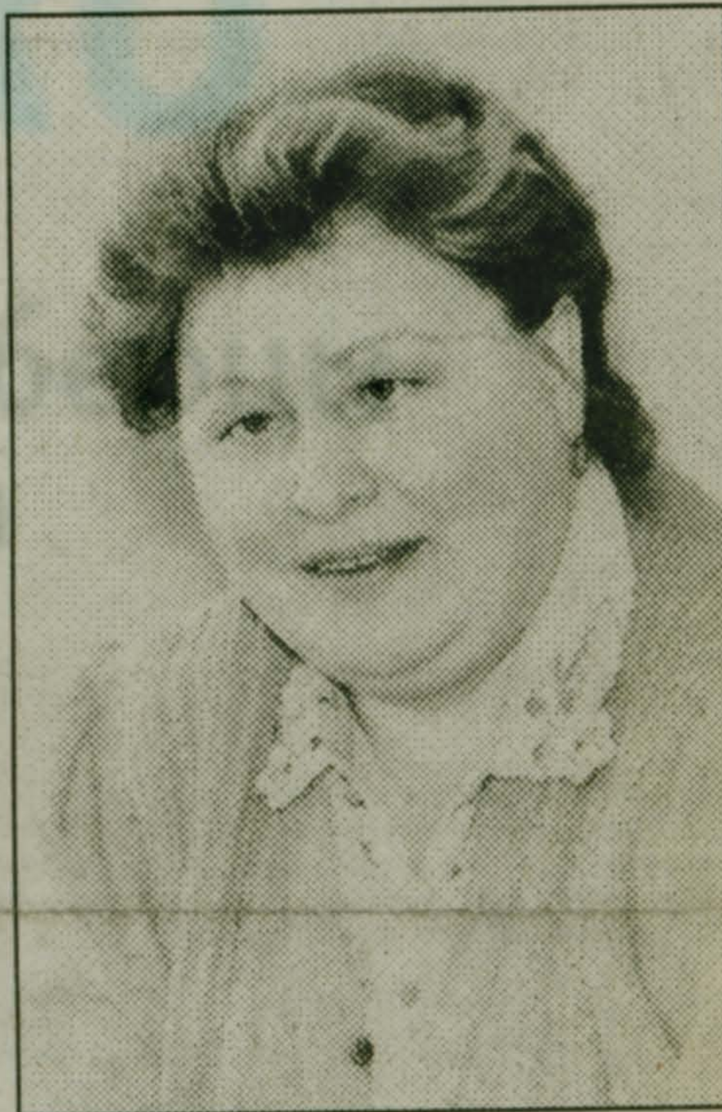
ного поселка рассказывает Н.И.Фаюстова и материалы 2-й стр. этого номера.