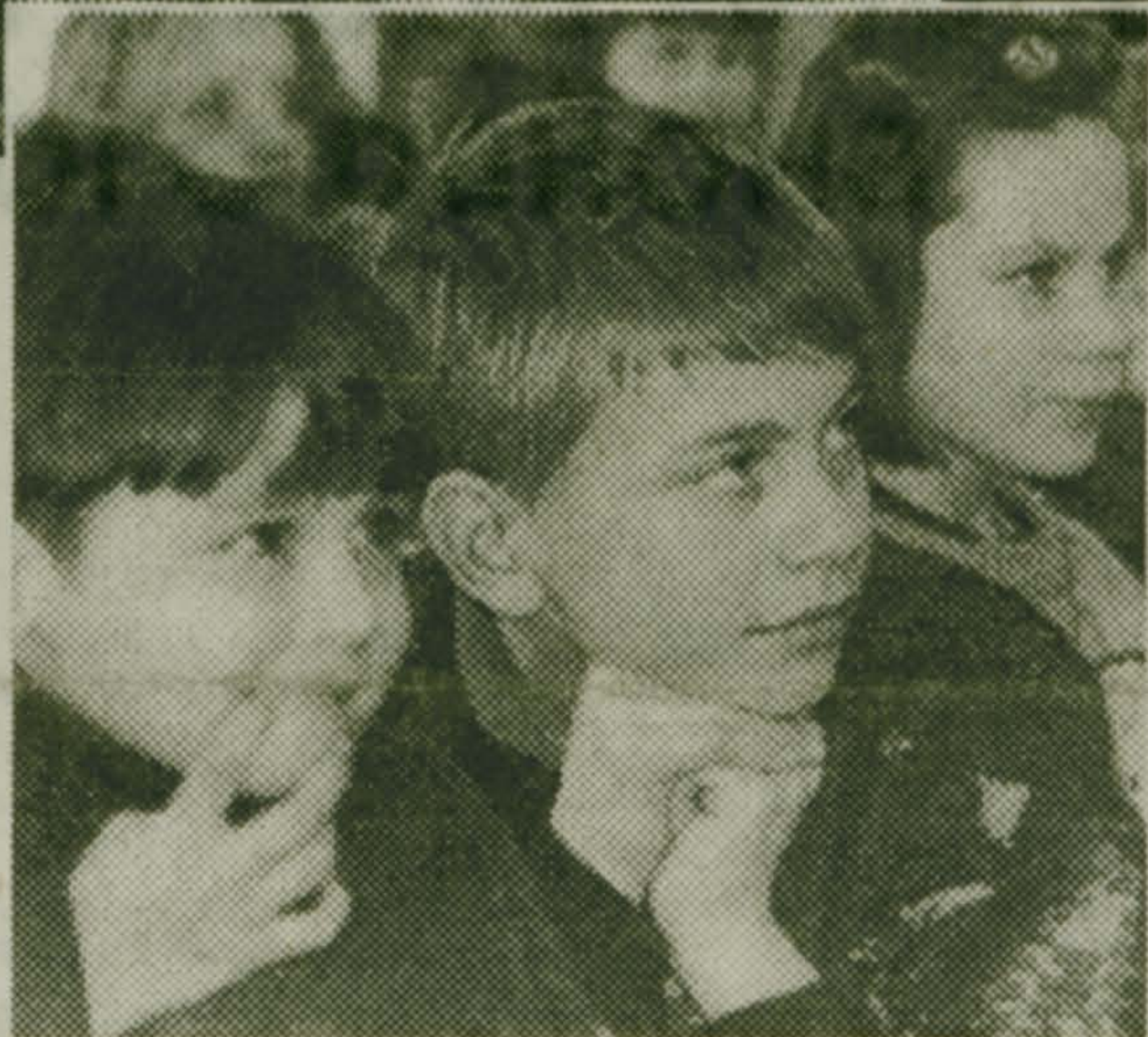
На снимках: выступает цирковая группа.

Если обделенные родительским вниманием дети не могут поехать в цирк, он сам приезжает к ним.