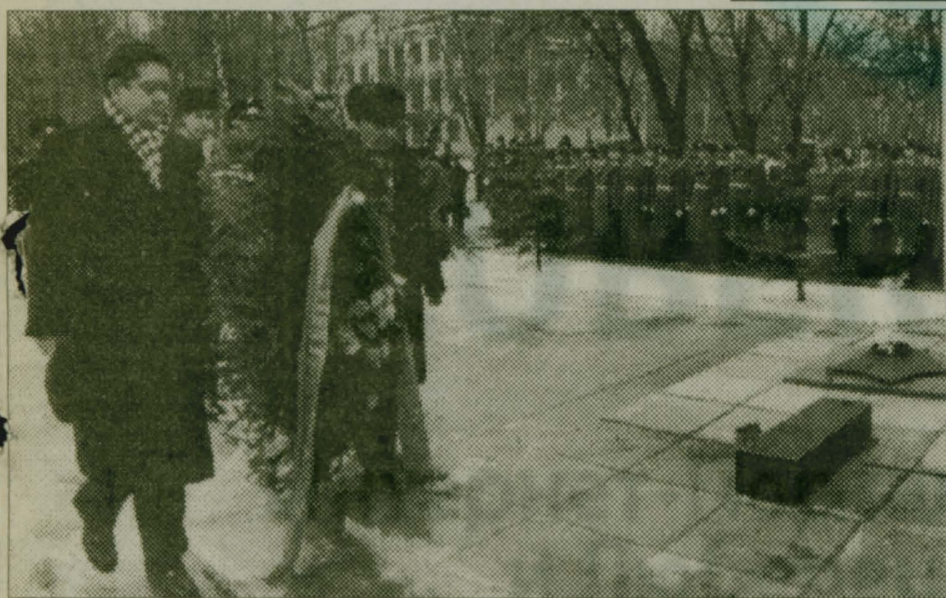
На всю оставшуюся жизнь...