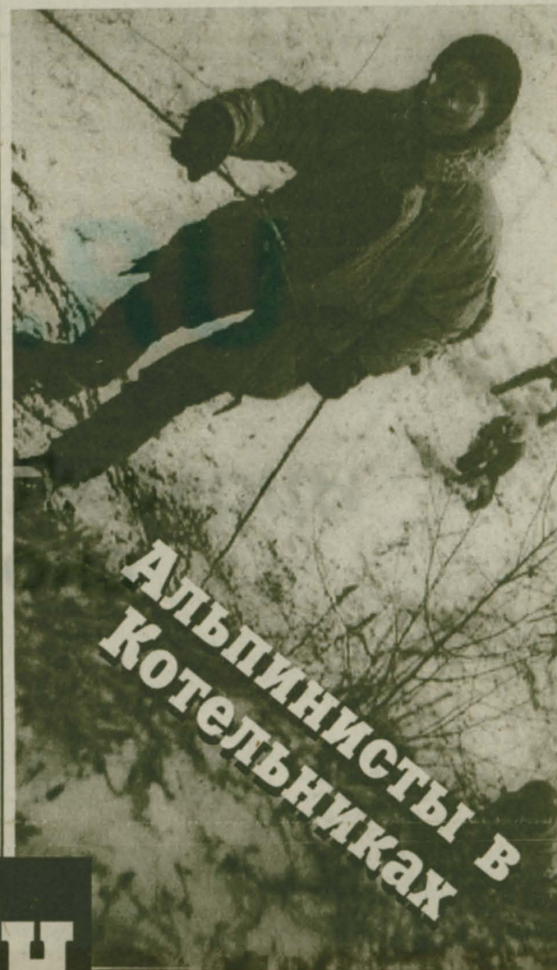
Альпинисты в Котельниках