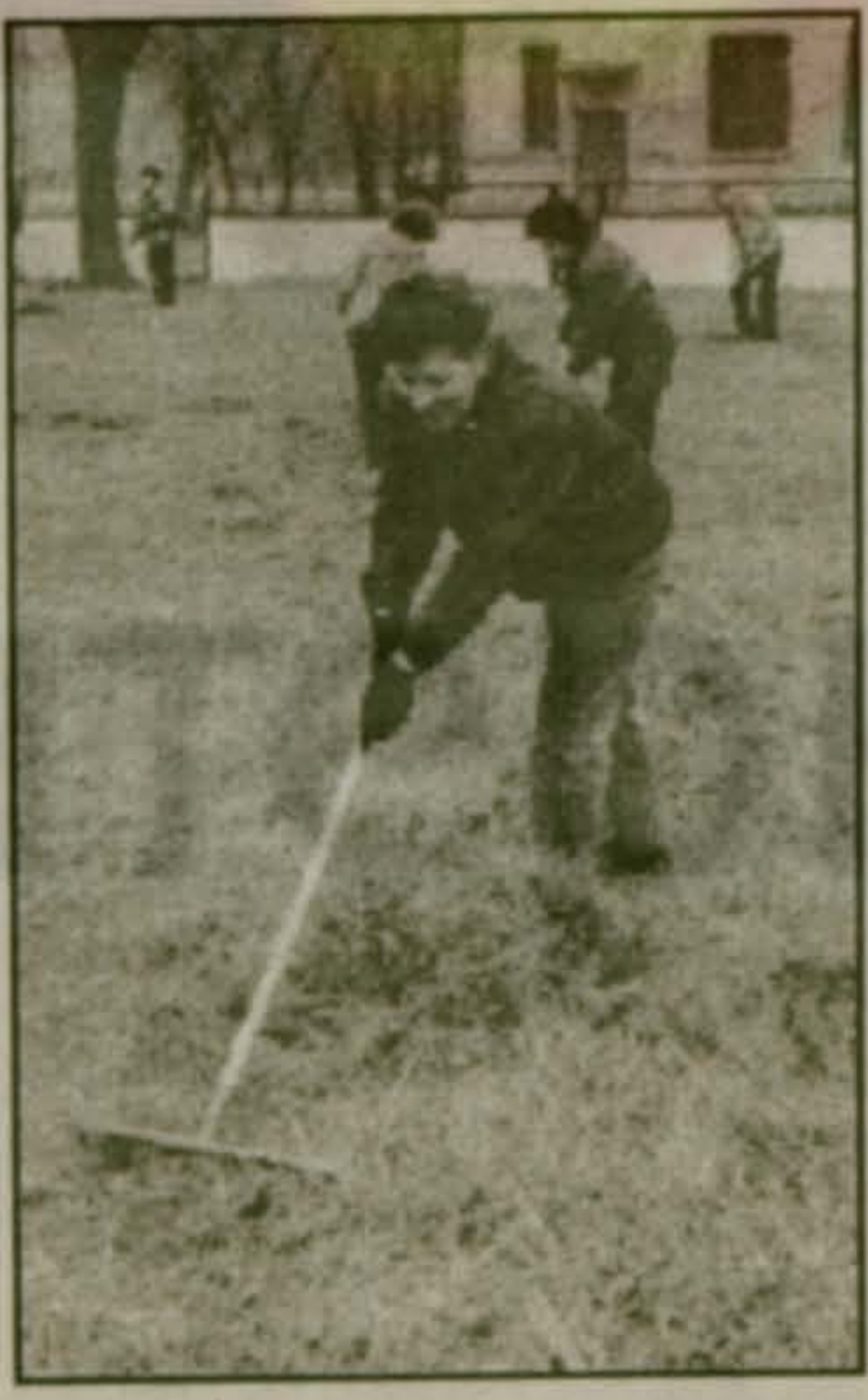
На снимке: кипит работа!