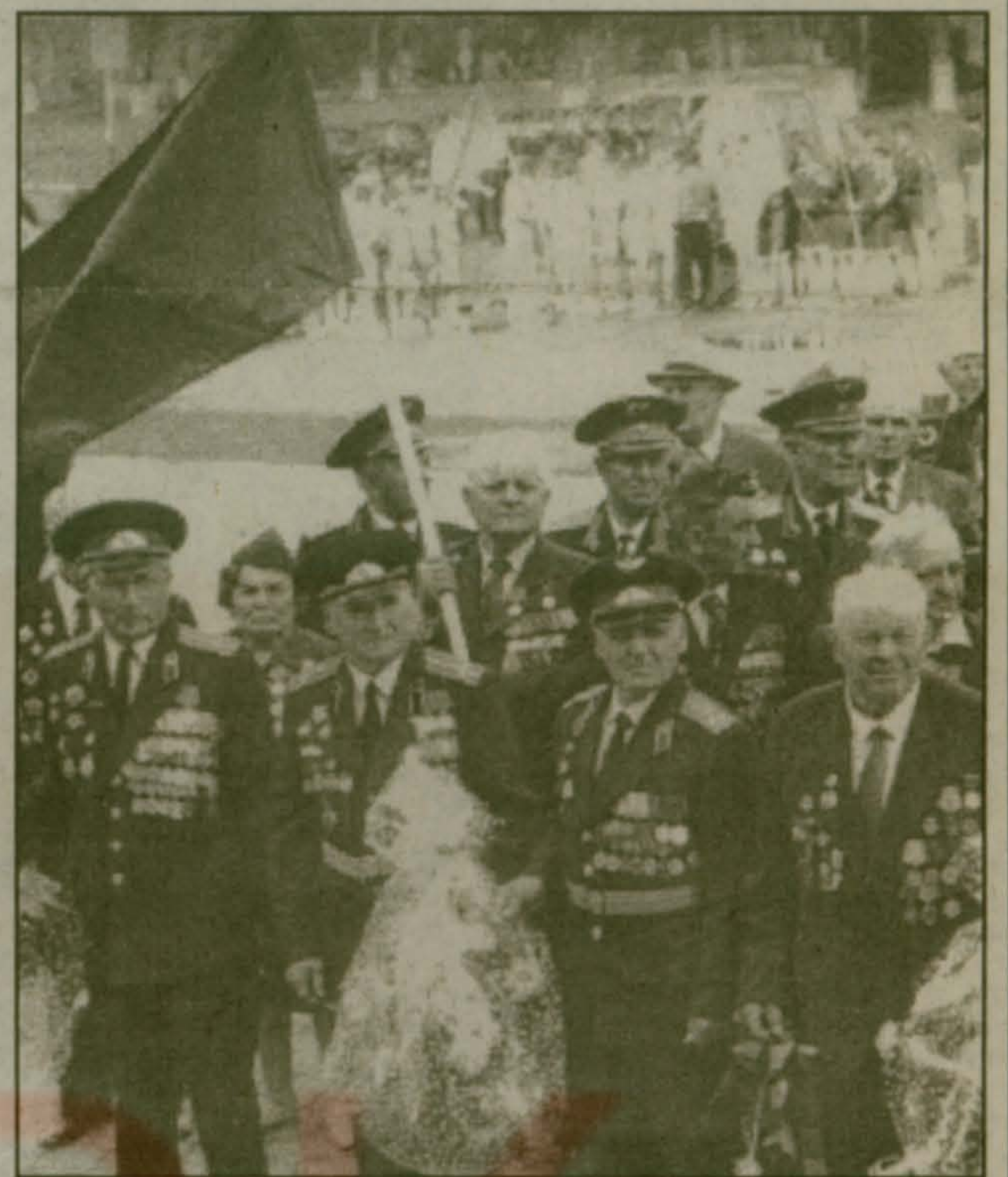
Люберцы. 9 мая 1996 г.