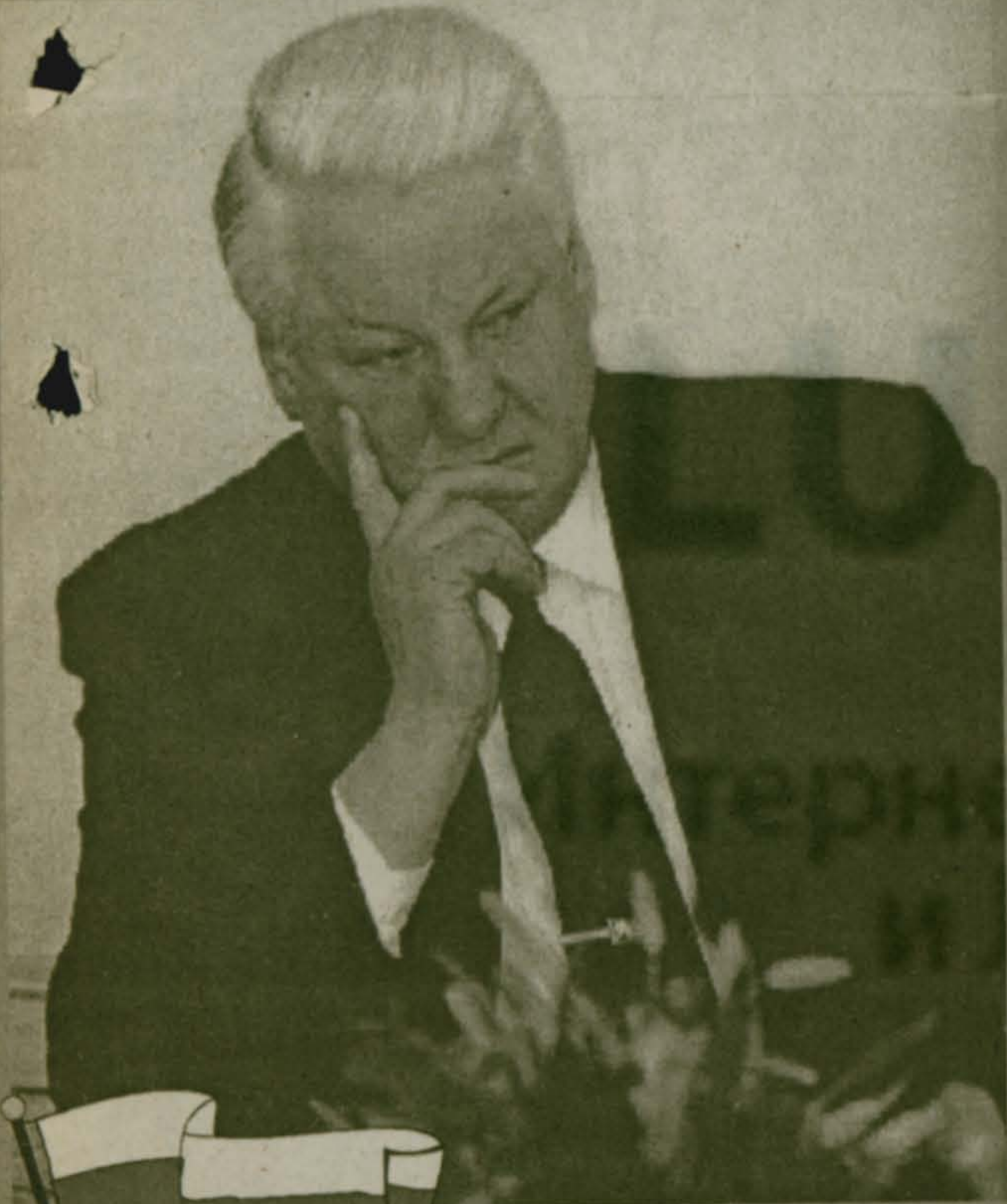
Б.Н.ЕЛЬЦИН - Президент Российской Федерации