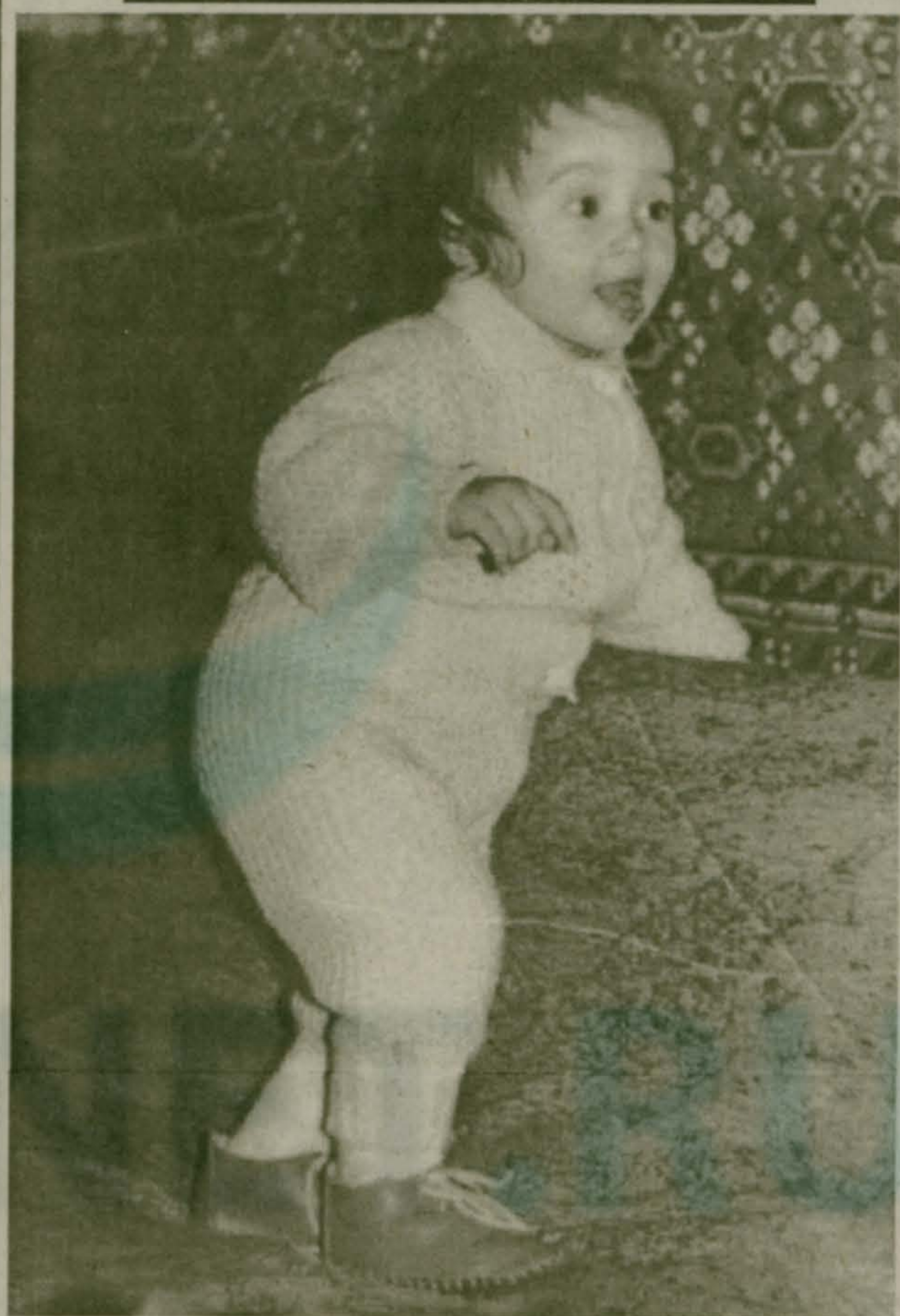
Топ-топ... Очень нелегки первые шаги.