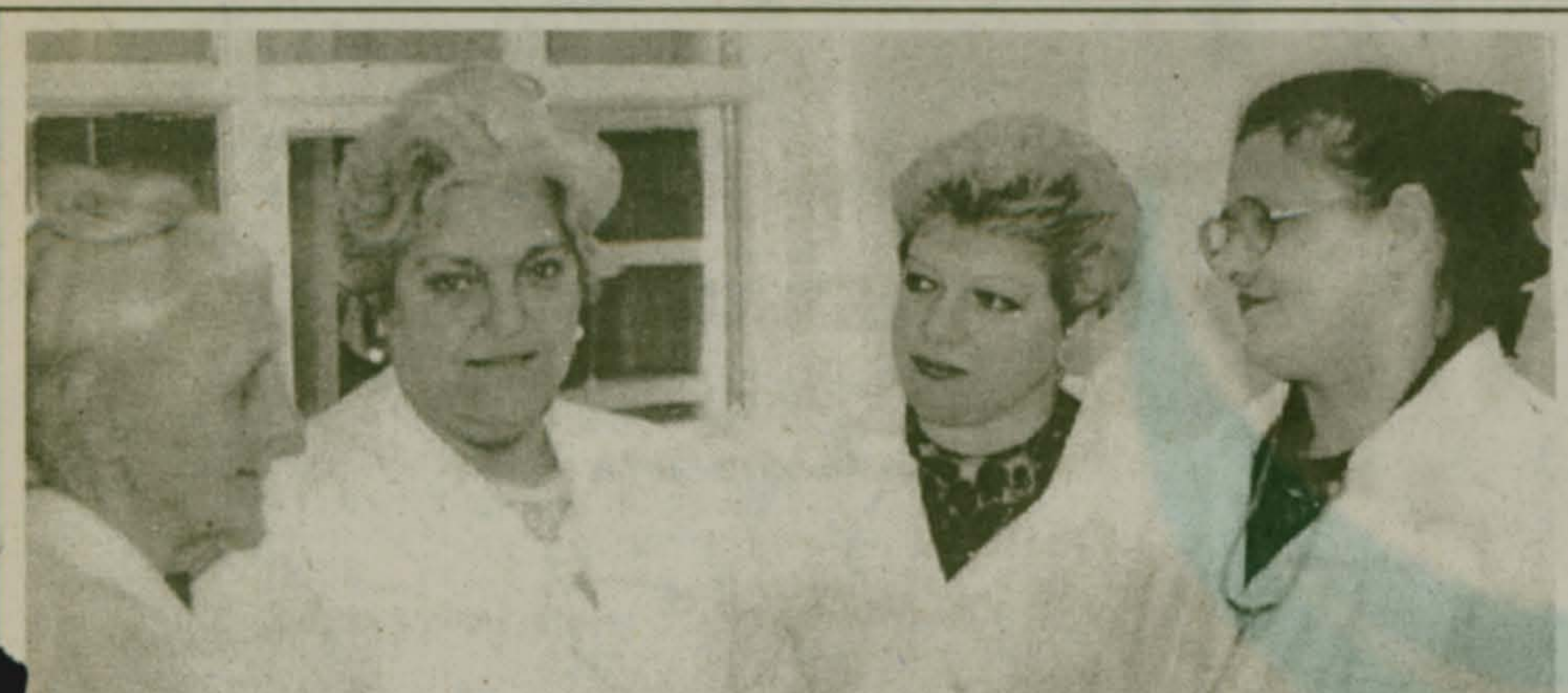
Немалую заботу об улучшении здоровья жителей поселка Октябрьский проявляют медицинские работники.

Лечить бронхит можно и травами. Для чего берутся в одной пропорции почки сосновые, листья подорожника и мать-и-мачехи. Эту смесь в течение двух часов настаивают в холодной воде, затем кипятят пять минут и процеживают. Употребляют по стакану три раза в день.