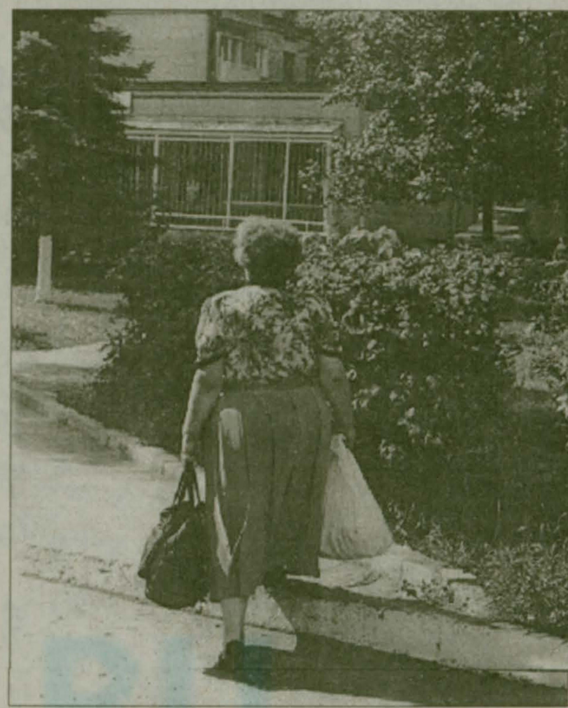
Люберчанки "сумчатые"