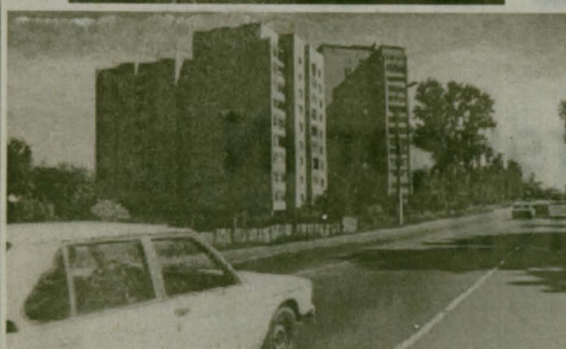
Красково сегодня. На главной магистрали поселка - улице К.Маркса.