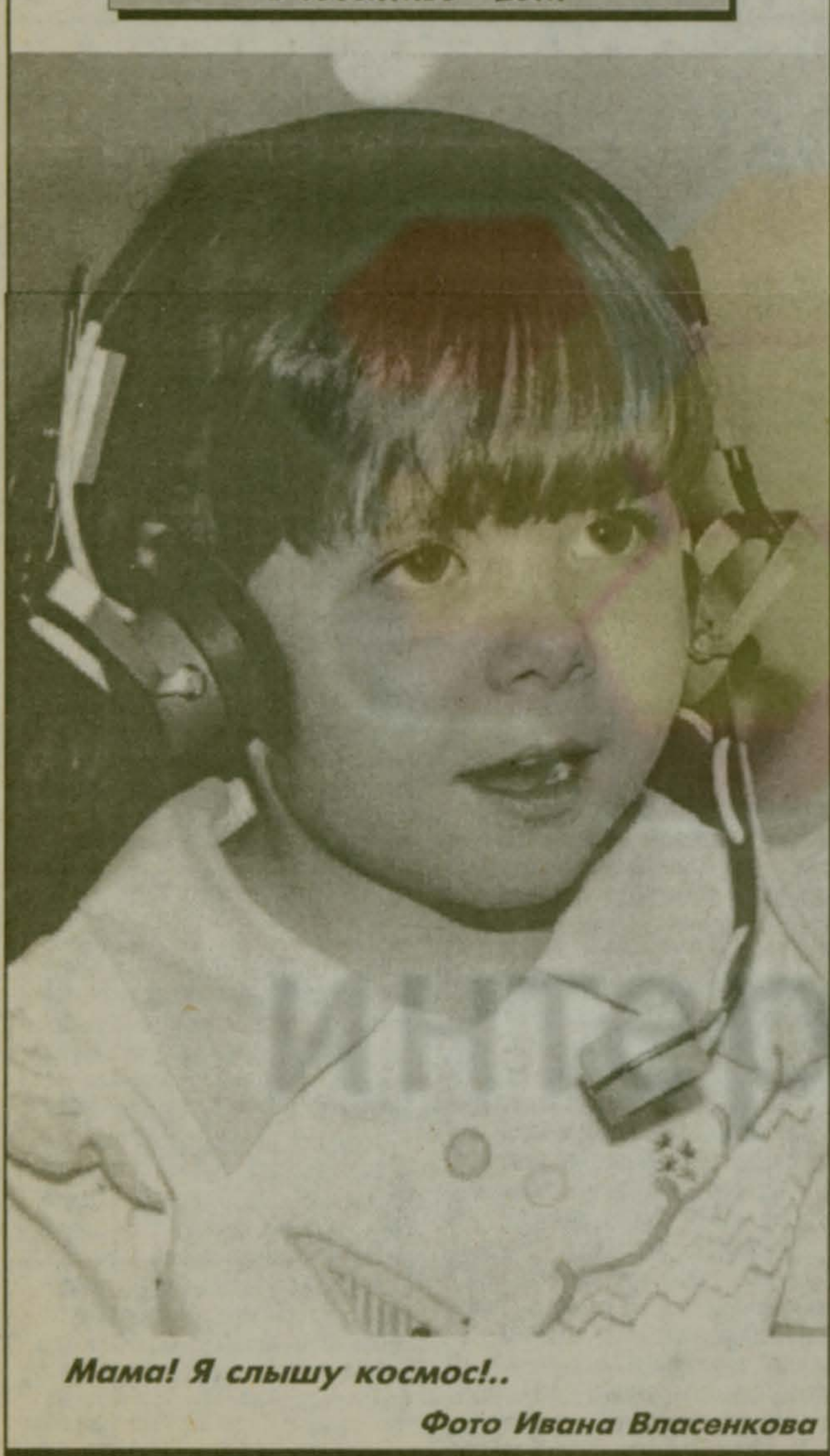
Мама! Я слышу космос!..