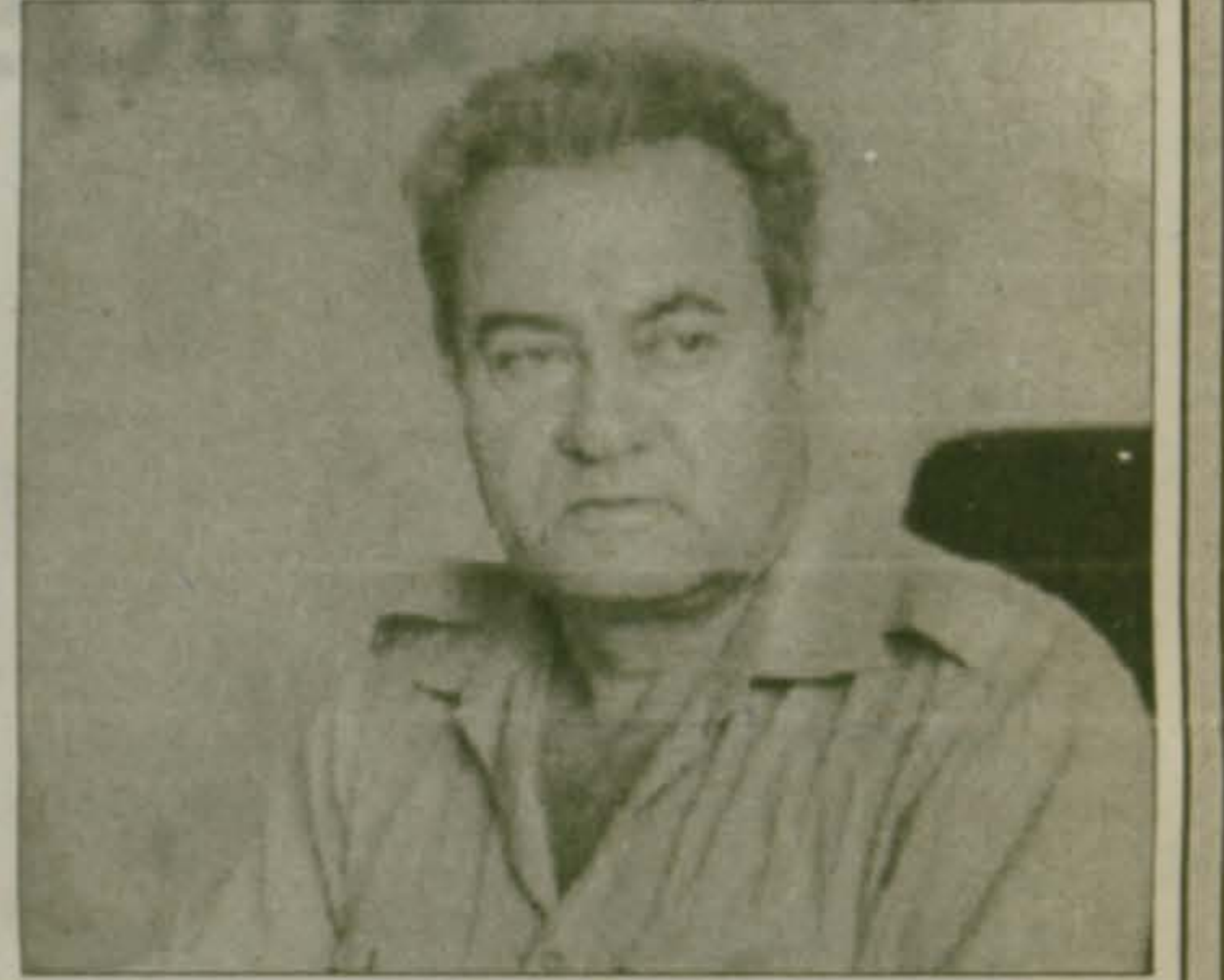
Фото Юрия Кирсанова