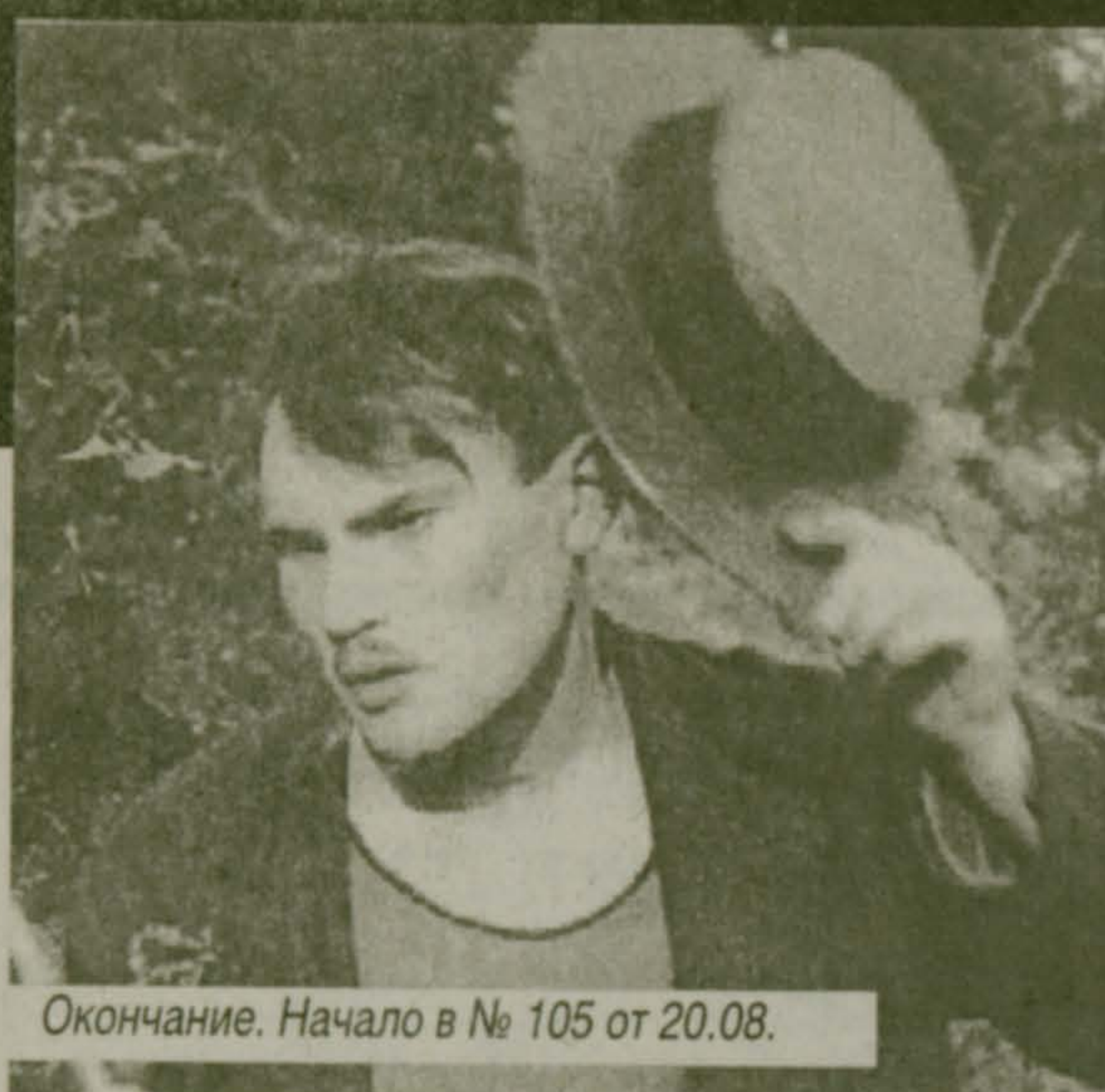
Окончание. Начало в № 105 от 20.08.