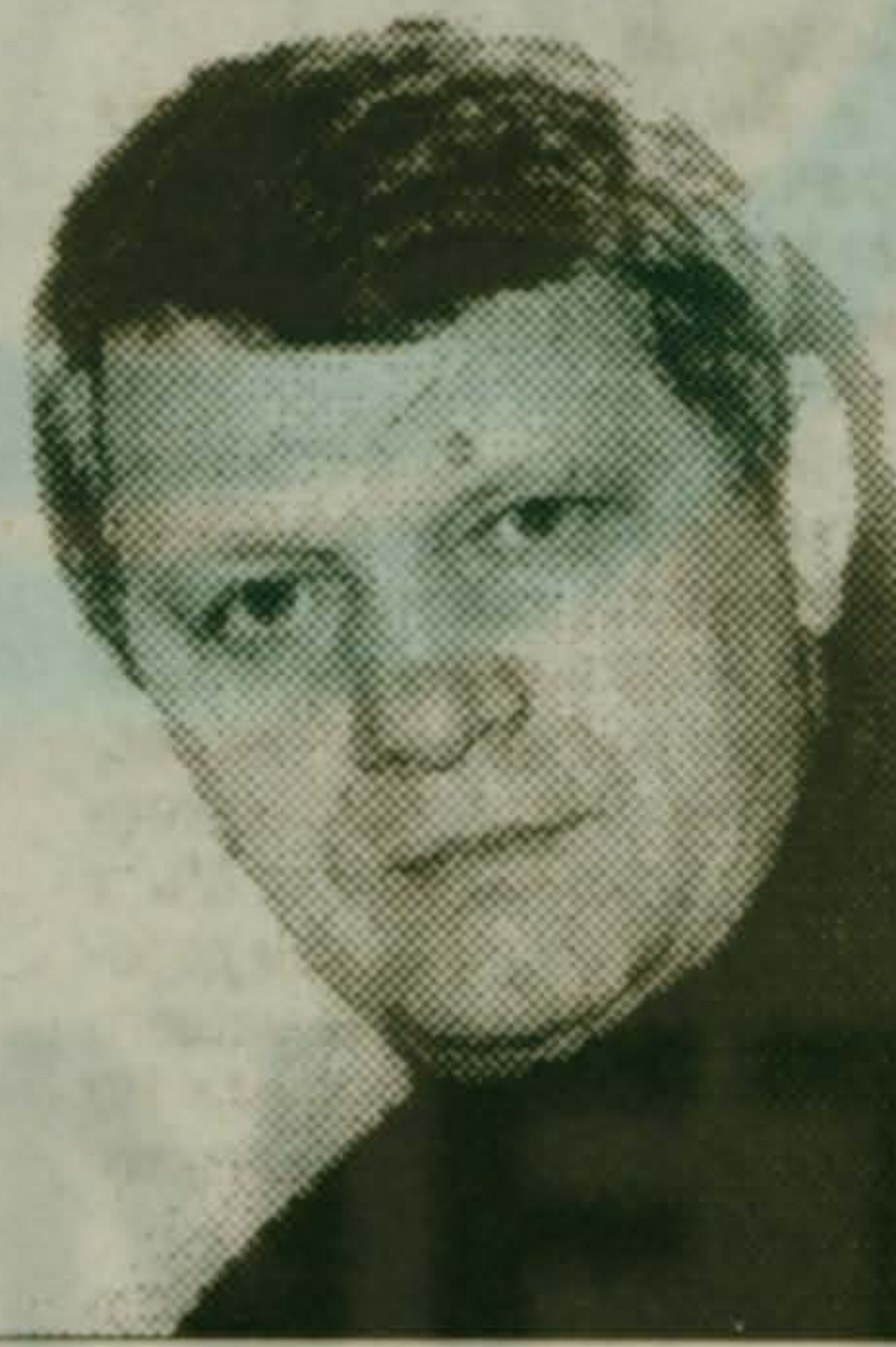
лей порядка на дорогах, нет пощады пьяным за рулем.

Вместе с тем стало меньше разбойных нападений и грабежей, краж (хотя я подозреваю, что люди обращаются в правоохранительные органы не по всем случаям). Больше нынче заводится дел в отношении злостных хулиганов, решительным образом мы пресекаем нецензурную брань, приставание к гражданам. Сотрудники ГАИ стали жестче спрашивать с нарушите-