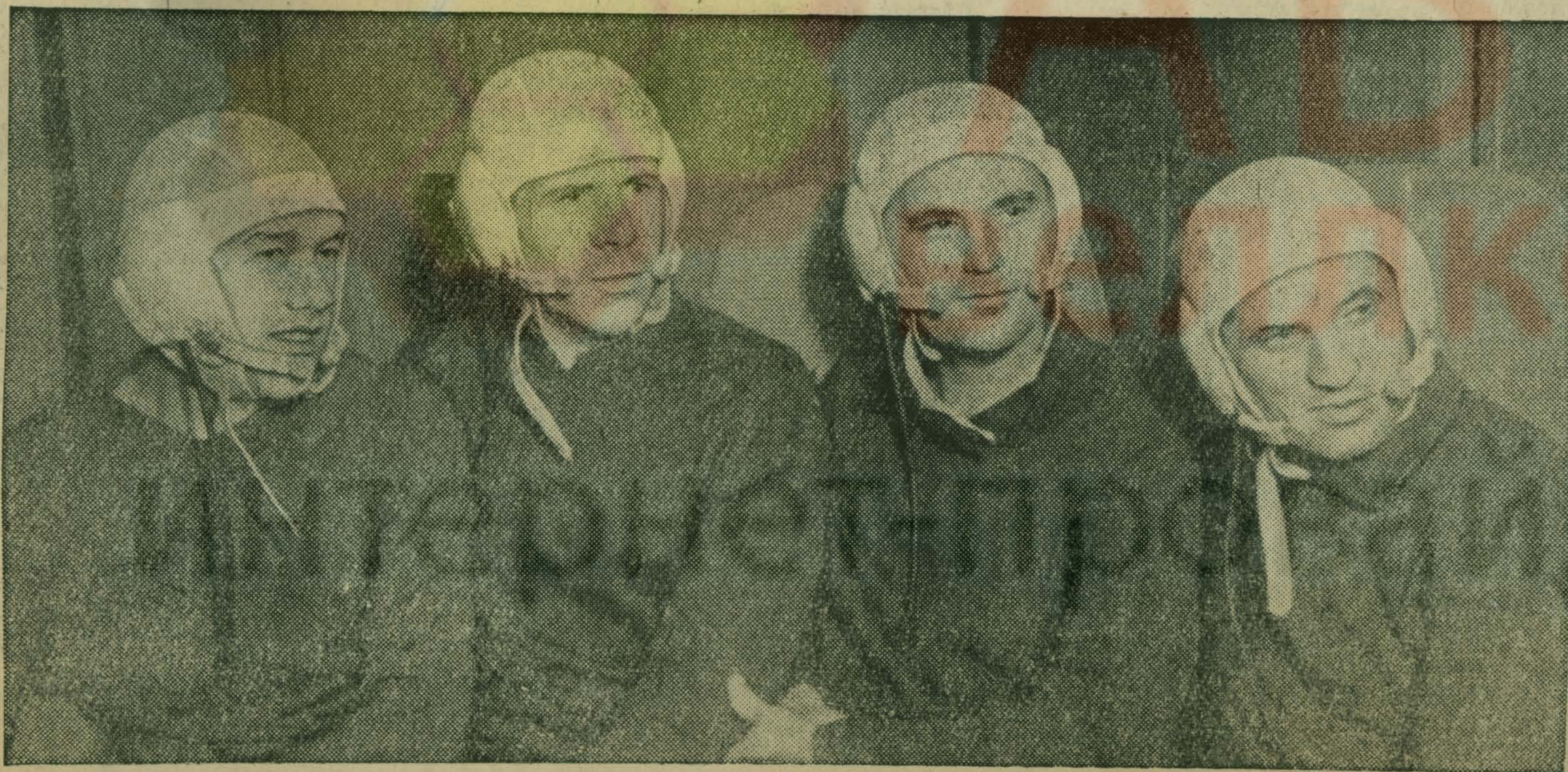
Летчики-космонавты (слева направо): член экипажа космического корабля «Союз-5» борт-инженер Алексей Станиславович ЕЛИСЕЕВ, член экипажа корабля «Союз-5» инженер-исследователь Евгений Васильевич ХРУНОВ, командир корабля «Союз-4» Владимир Александрович ШАТАЛОВ, командир корабля «Союз-5» Борис Валентинович ВОЛЫНОВ.