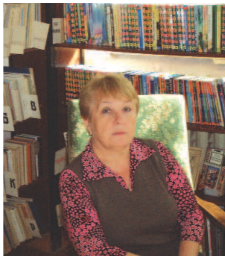
знают и в стране, и за рубежом.