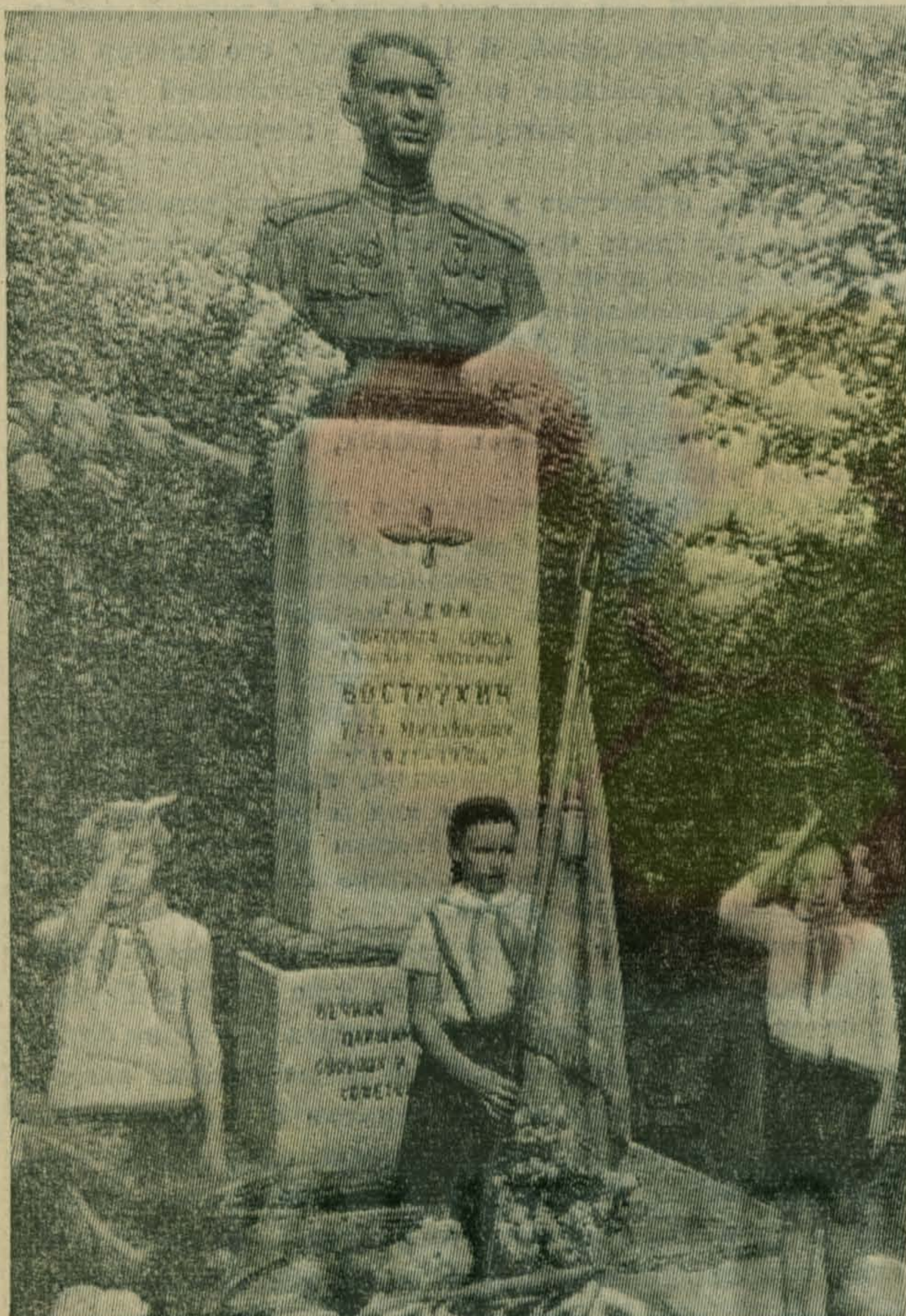
Этот памятник русскому летчику стоит далеко отсюда — в поселке Моховое Орловской области, но он имеет прямое отношение к нам, потому что поставлен он жителю деревни Выхино, Герою Советского Союза Петру Михайловичу Вострухицу. Здесь, в небе над Моховым, в неравном бою 19 июля 1943 года погиб отважный сокол.