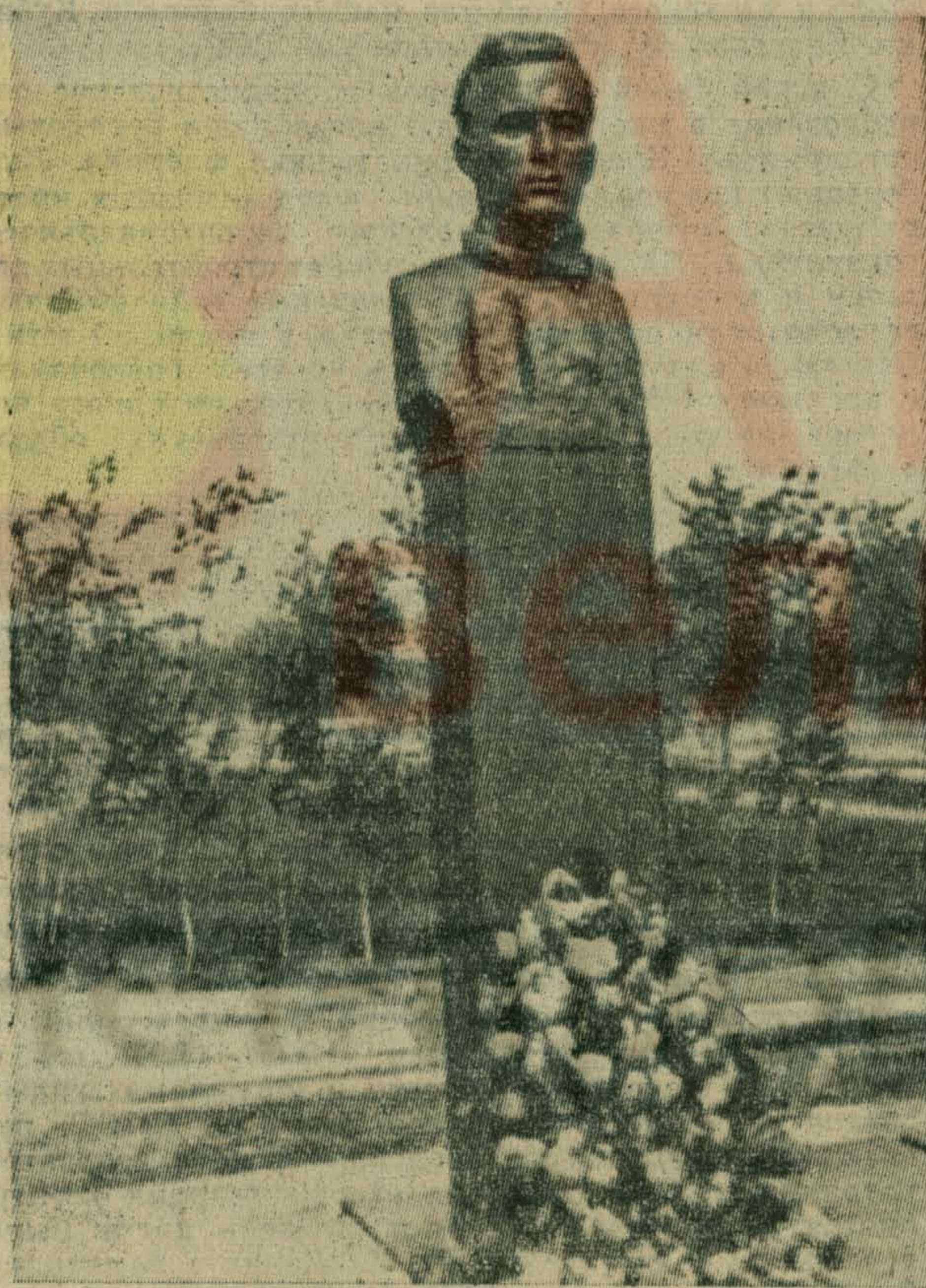
Памятник М. Митрофанову.

25 января 1966 г. вышел Указ Президиума Верховного Совета СССР о награждении (посмертно) Михаила Николаевича Митрофанова орденом Ленина.