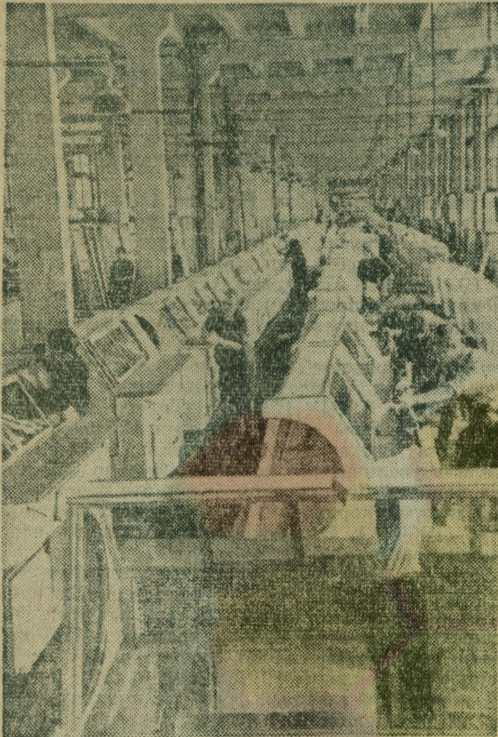
В сборочном цехе завода торгового машиностроения.

Годовой объем выпуска промышленной продукции составляет 450 миллионов рублей. Продукция с маркой наших предприятий идет во все края и области страны, социалистические и десятки капиталистических стран.