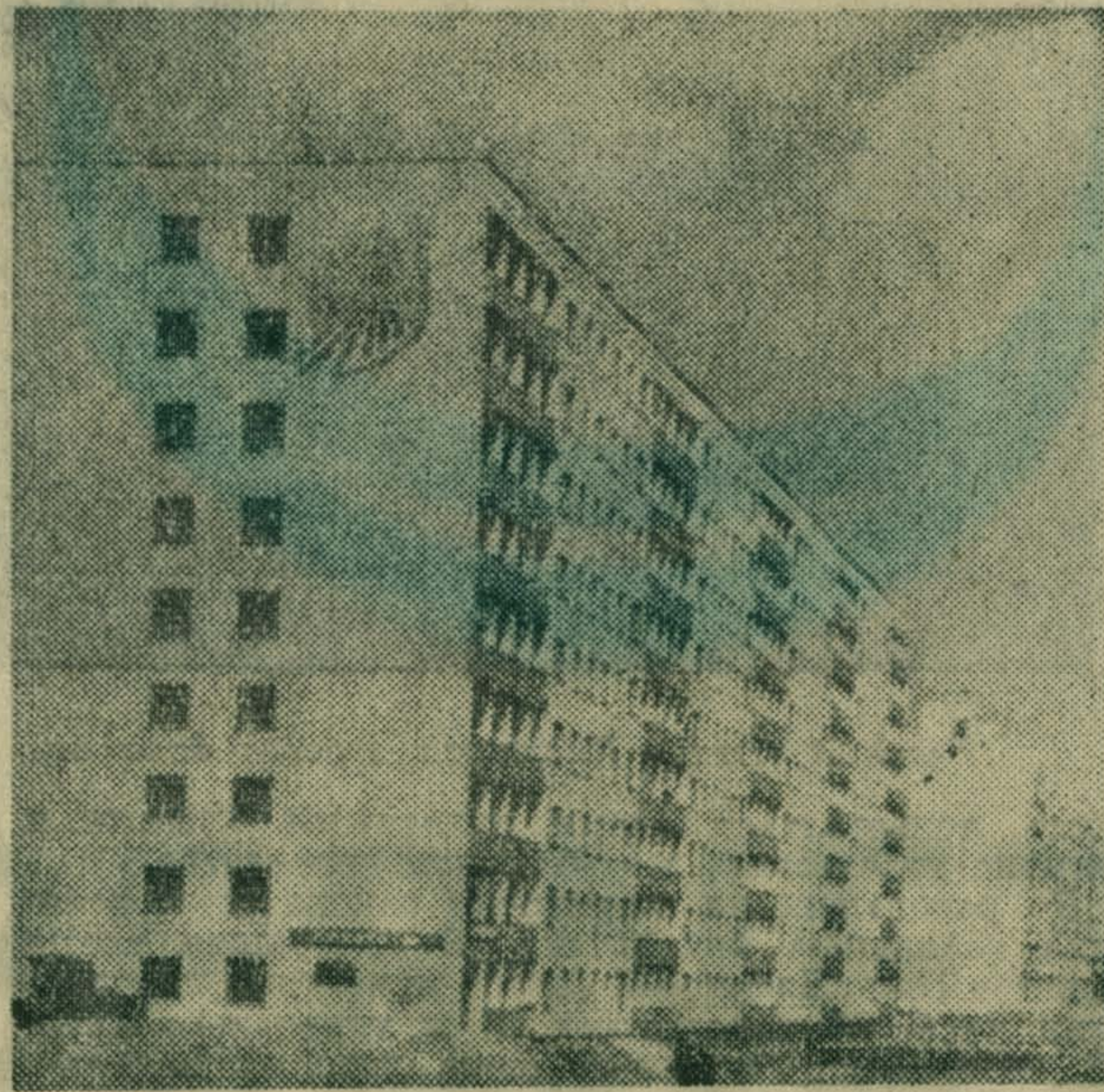
Вот такие дома строятся в новом 115-м квартале г. Люберец.

Руками люберецан воздвигнуто много важных объектов в других областях страны. СМУ-9 треста Союзгазпромстрой, которое базируется в Люберецах, приняло самое активное участие в прокладке нефтепровода «Дружба» и газопровода Средняя