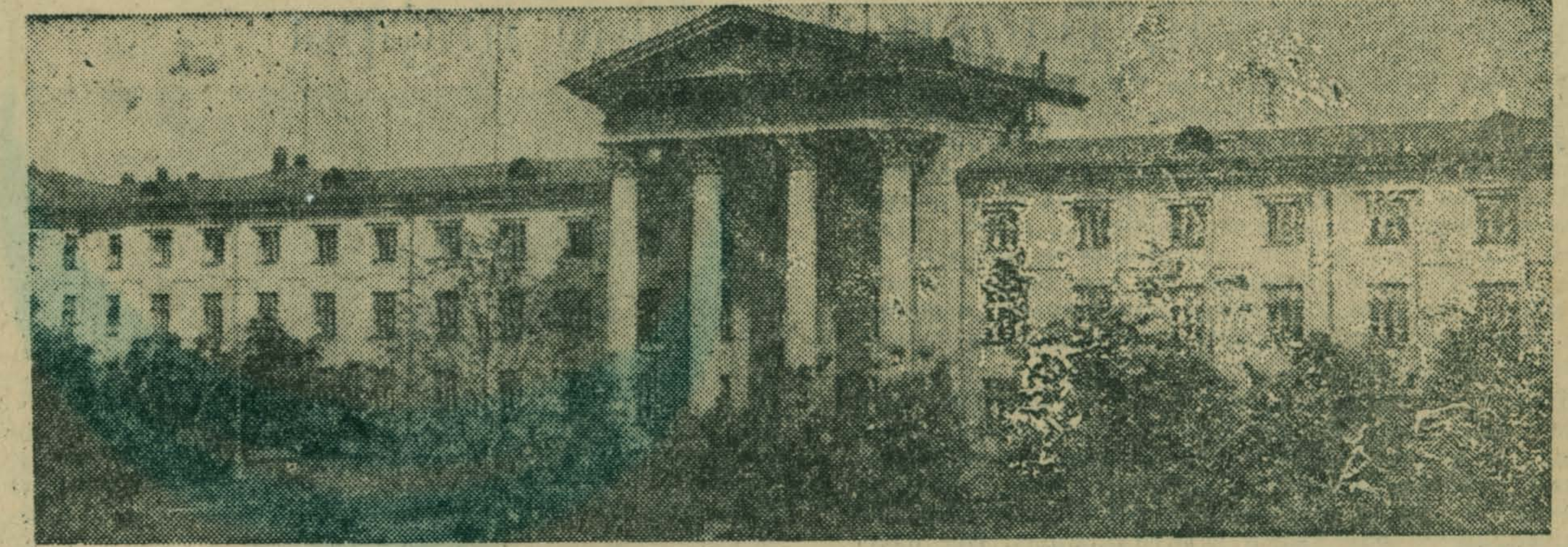
Главный корпус Института горного дела им. А. А. Скочинского.

Советская власть впервые в истории осуществила действительную демократизацию культурной жизни. Она не только провозгласила все завоевания культуры всенародным достоянием, но и предоставила трудящимся фактическую возможность пользоваться всеми духовными благами и активно участвовать в культурном творчестве.