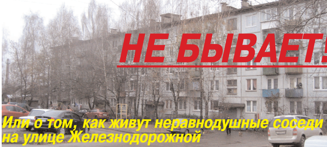
Или о том, как живут равнодушные соседи на улице Железнодорожной