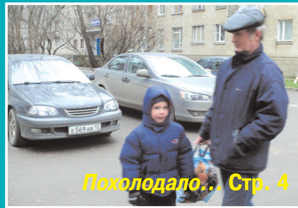
Похолодало... Стр. 4