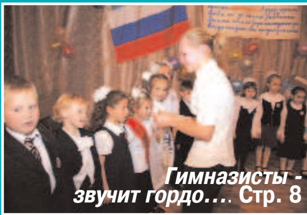
Гимназисты - звучит гордо... Стр. 8