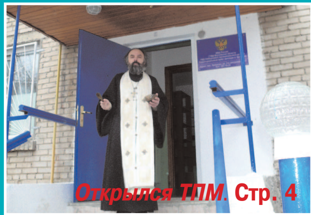
Открылся ТПМ. Стр. 4