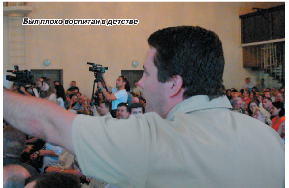
Был плохо воспитан в детстве