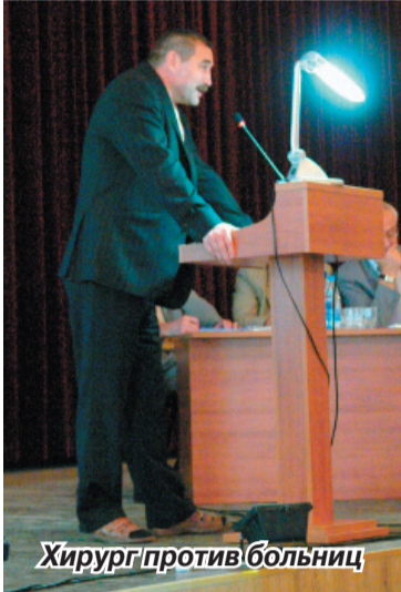
Хирург против больницы

гами, свистела, хохотала, одна тетя все время римским жестом опускала большой палец вниз: мол, казнить – нельзя помиловать такой проект!).