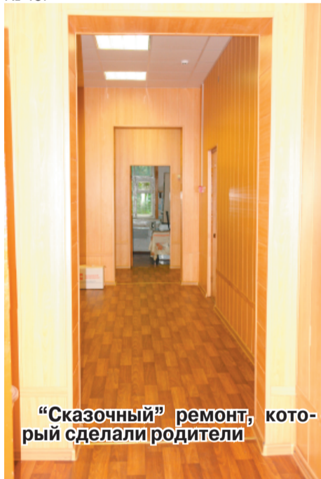
«Сказочный» ремонт, который сделали родители

- Все можно было сделать в летние каникулы, а не доводить ситуацию до крайности, - говорит молодой отец, держа за руку семилетнюю дочку. Он растерян, огорчен. Девочка должна была прийти 1 сентября в первый класс малаховской средней школы № 48.