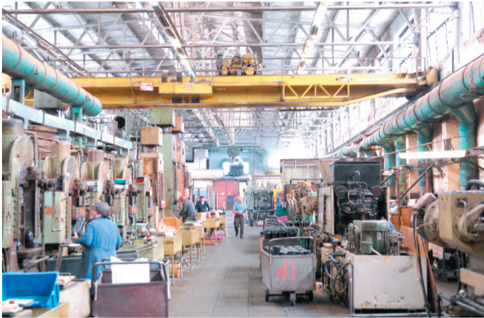
ЛЮБЕРЕЦКИЙ ЗАВОД НУЖЕН ГОРОДУ И СТРАНЕ

ОАО «Люберецкий завод пластмасс» (ЛЗП) было основано в 1946 и на тот момент входило в структуру Министерства путей сообщения. В 2004 году 100 % акций завода были переданы в управление Федерального агентства по управлению государственным имуществом (ФАУГИ). Предприятие является крупнейшим в России производителем втулок для крепления рельсов к шпалам. В 2008 году объем реализации составил 65 миллионов рублей. Заводу принадлежит участок земли площадью 12,5 гектаров рядом с Москвой.