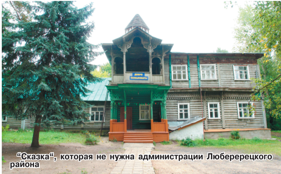
«Сказка», которая не нужна администрации Люберерецкого района