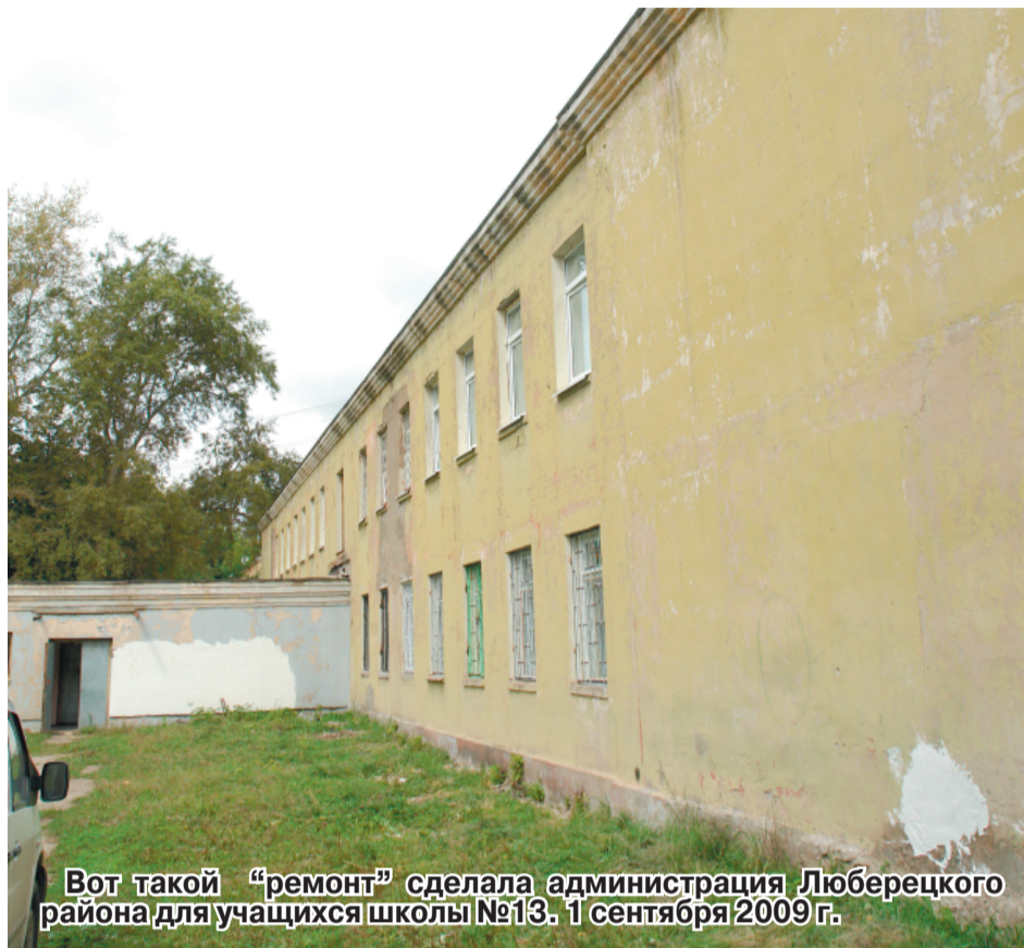
Вот такой «ремонт» сделала администрация Люберецкого района для учащихся школы №13. 1 сентября 2009 г.