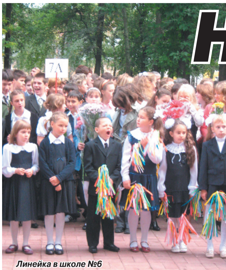
Линейка в школе №6

В школе №6 города Люберцы праздничная линейка началась немного позже обычного. Всё происходило по давней и прочной традиции: белые банты, цветы, выступления учителей и школьников, старые добрые песни о школе.