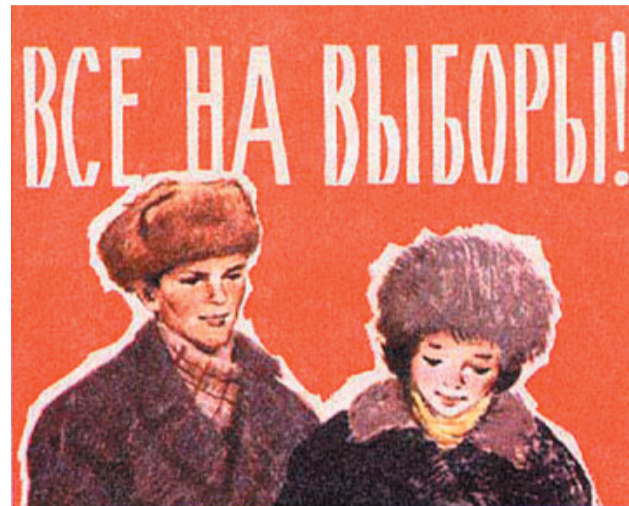
взаимодействие между участниками процесса выборов в рамках подписанного заявления.

Часть решения носит рекомендательный характер и обращено ко всем избирательным объединениям Московской области. Кроме того, оно содержит призыв организовать