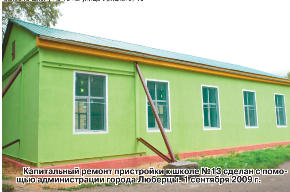
Капитальный ремонт пристройки к школе №13 сделан с помощью администрации города Люберцы. 1 сентября 2009 г.

в Люберцах. Предлог был тот же, что и в Маляховке: здание старое, требует ремонта, денег в бюджете нет. «В микрорайоне нет другой школы? Пусть ходят в школу № 12, ездят в Москву, да какое нам дело до вас