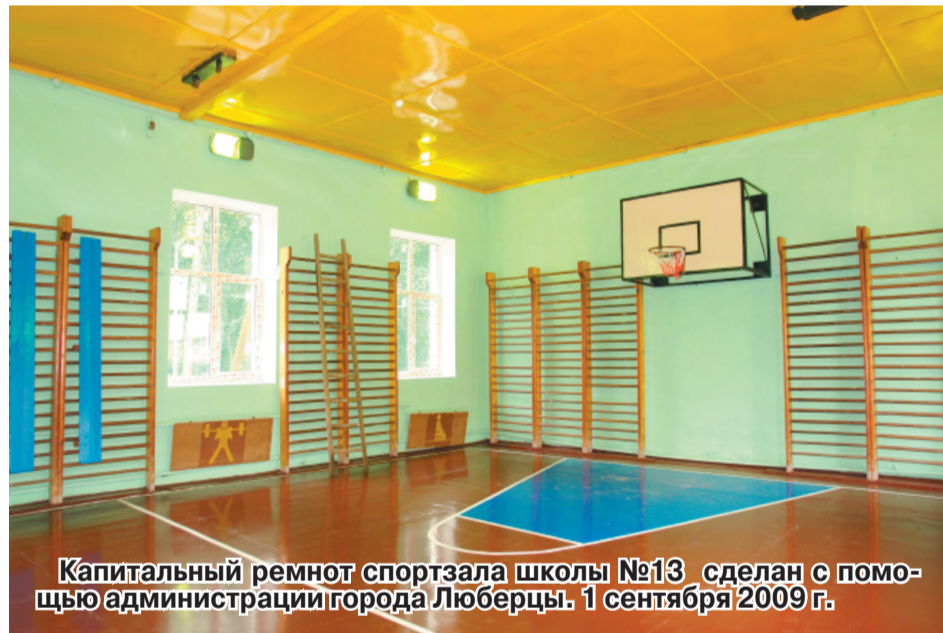
Капитальный ремонт спортзала школы №13 сделан с помощью администрации города Люберцы. 1 сентября 2009 г.

Надо сказать, что и педагогический коллектив потрудился на совесть. Все учителя, работники охранной службы, старшеклассники помогли в ремонте спортзала.