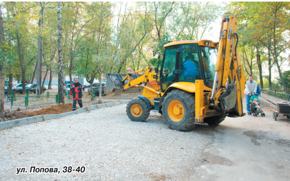
ул. Попова, 38-40