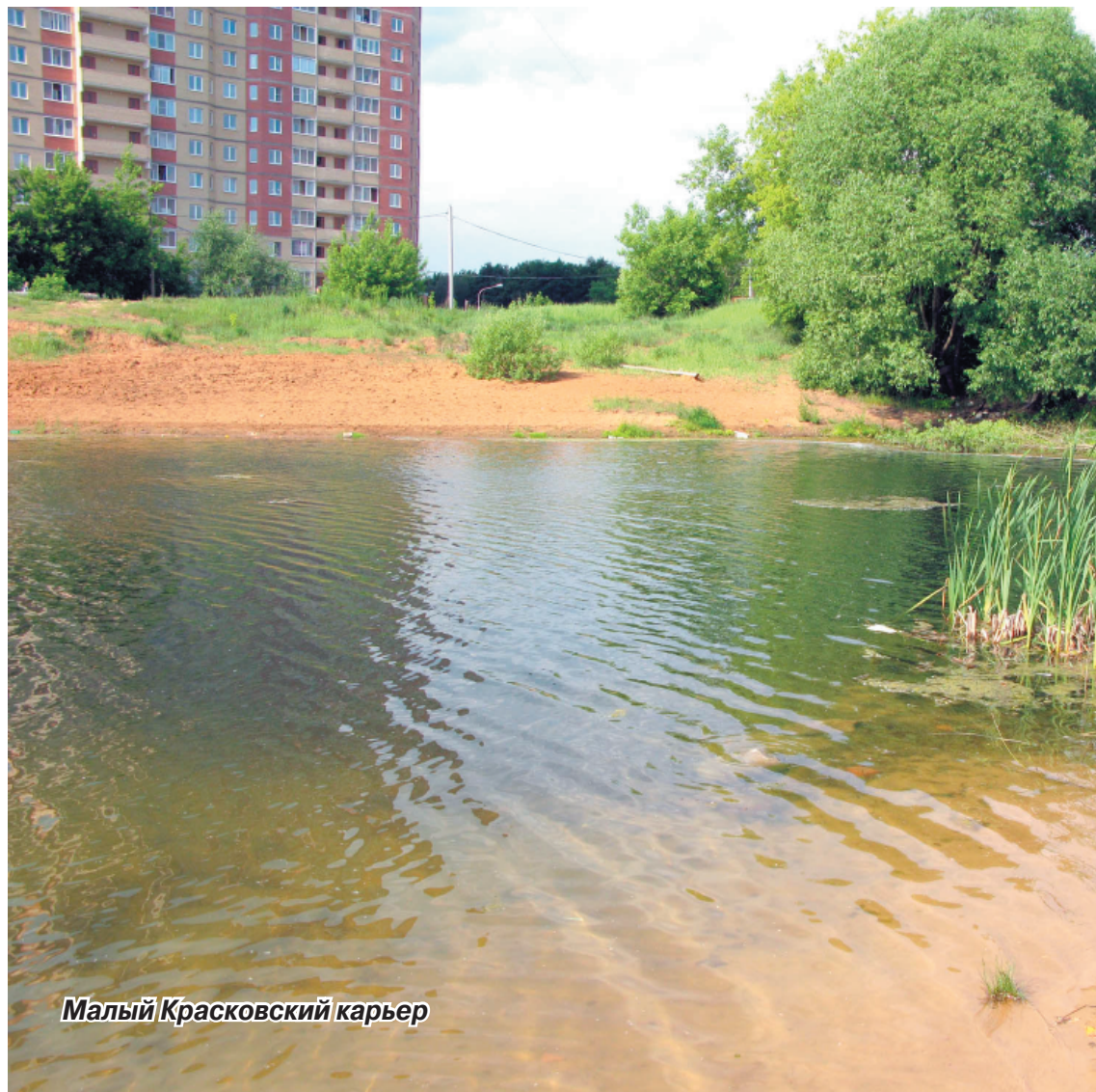
Малый Красковский карьер