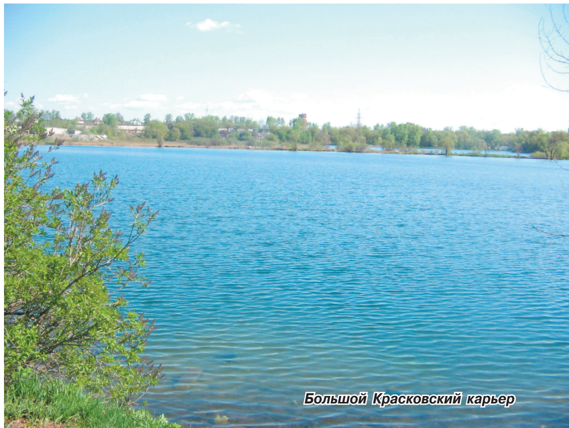
Большой Красковский карьер