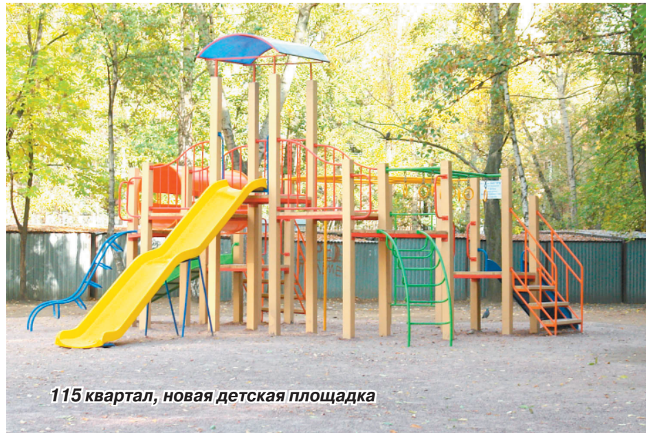
115 квартал, новая детская площадка

Повезло не только малышам, но и их родителям. Рядом с новенькой детской площадкой предусмотрена зона отдыха для более старшего поколения. Здесь оборудован уютный скверик. Центром композиции этого местечка стала красивая клумба, усаженная цветами и отделанная искусственным камнем. Вокруг клумбы расположились удобные скамейки. Дорожки для пешеходов вымощены тротуарной плиткой, вокруг зоны отдыха засеян газон. Так что