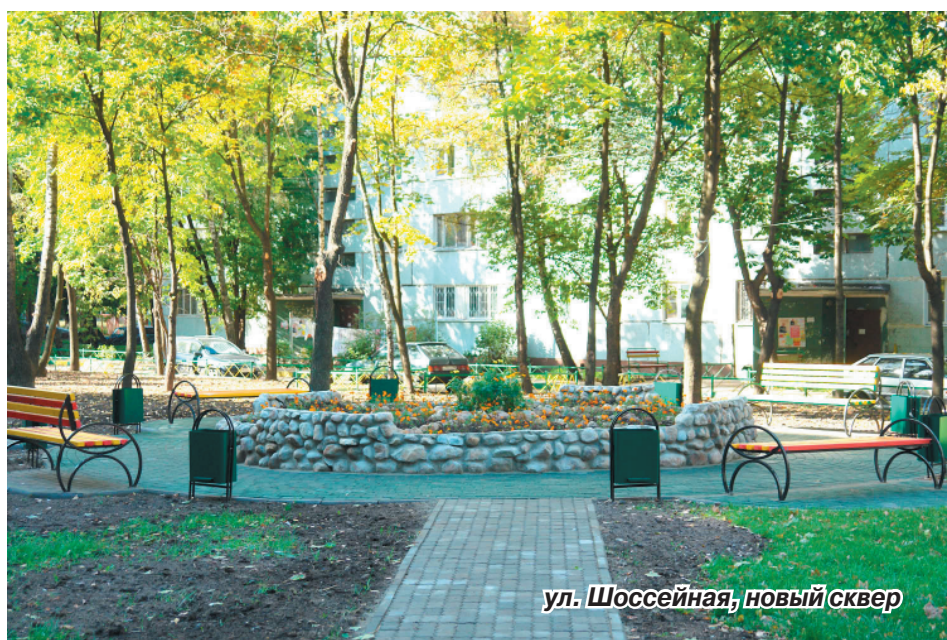
ул. Шоссейная, новый сквер

На Шоссейной улице во дворе домов 9 и 11 недавно закончились работы в рамках программы благоустройства. Здесь не только отремонтирован подъезд к домам и