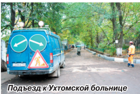
Подъезд к Ухтомской больнице

Как сообщила начальник отдела дорожного хозяйства администрации