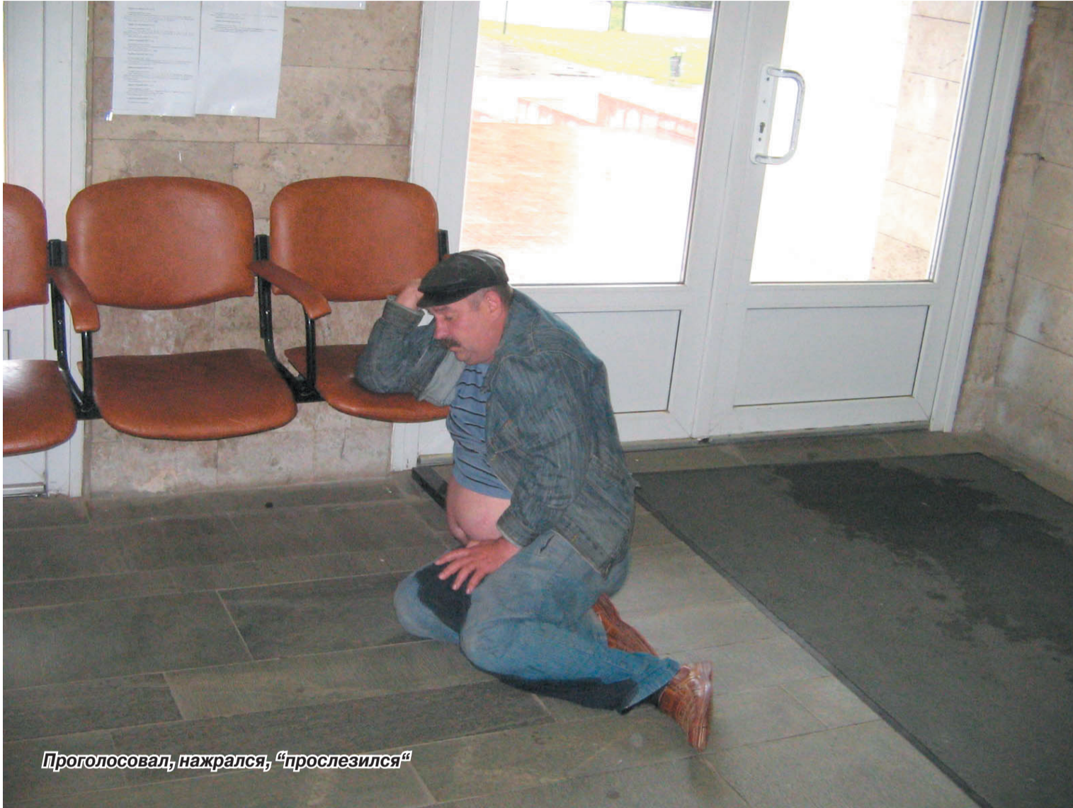
Проголосовал, нажрался, "прослезился"

Меня откровенно порадовала эта надпись, сделанная кем-то из люберчан и, появившаяся поверх агитки с изображением пухлощекого кучерявого дяденьки из главной партии страны. Снизу кто-то приписал: «Правильно!». Агитка была наклеена прямо на свежепокрашенный фасад дома по Октябрьскому проспекту. И в этом коротком изречении – оценка деятельности заезжих столичных господ-пиарщиков. Они по-крупному осваивают выборный бюджет, состоящий из «общака». «Общак» собирали на тайном заседании заинтересованных лиц в Малаховском ДК «Союз». И вот теперь настала пора его тратить – вы, наверняка догадываетесь, кто и на что его распиливает.