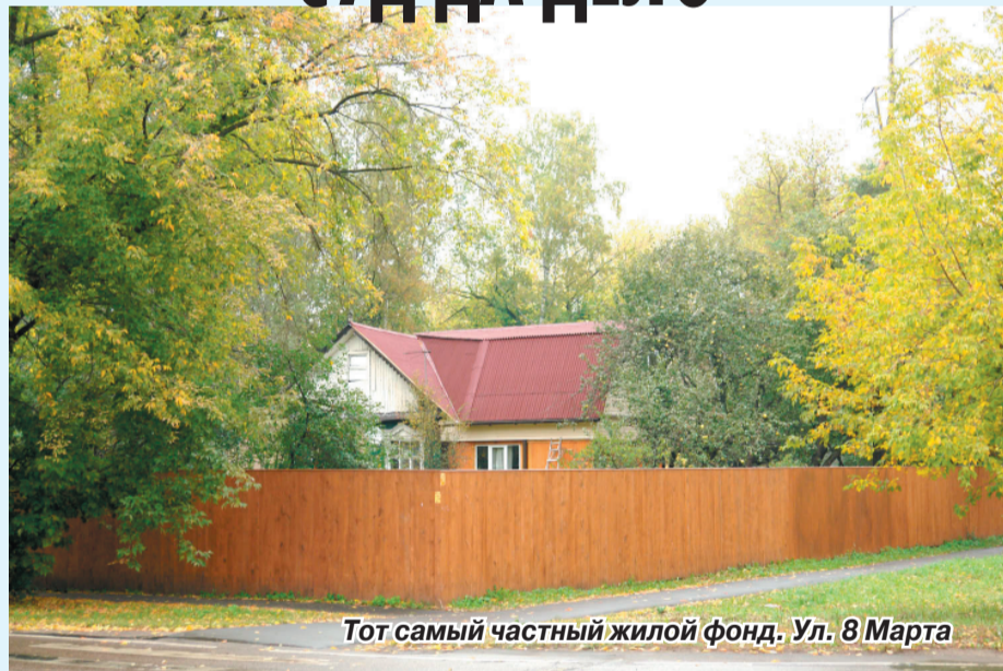
Тот самый частный жилой фонд. Ул. 8 Марта

Проект генплана развития г. Люберцы, разработанный в свое время по заданию районной администрации ГУП МО «НИИПИ Градостроительства», предусматривал, в частности, что некоторые территории вдоль железной дороги (улицы 8 Марта, Ленина, Володарского, Кожуховская и т. д.) будут превращены в зону коммунального хозяйства. Эта перспектива вызвала недовольство среди большей части жителей частного сектора, поскольку они могли лишиться своих домов и приусадебных участков. Люди обратились с иском в суд. В такой редакции, согласно полномочиям, район и передал проект генплана в город, в связи с чем ответчиком в этом судебном деле стала городская администрация.