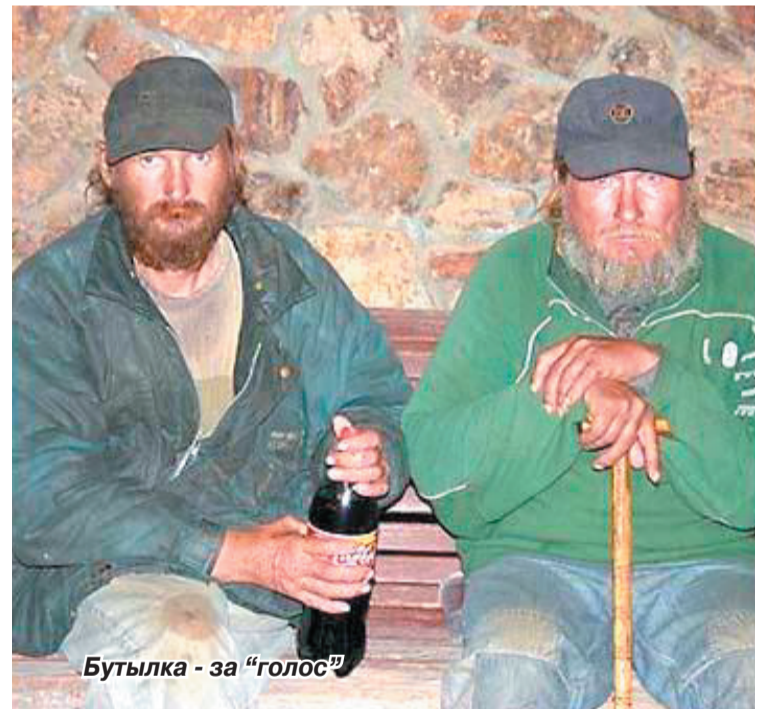
Бутылка - за "голос"