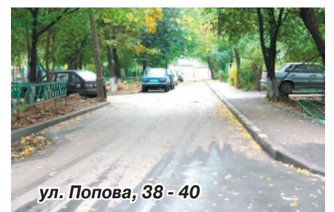
ул. Попова, 38 - 40