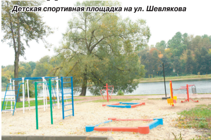
Детская спортивная площадка на ул. Шевлякова

Завершающим «аккордом» благоустройства набережной у Наташинских прудов стало появление здесь к празднованию Дня города детского спортивного комплекса на ул. Шевлякова.