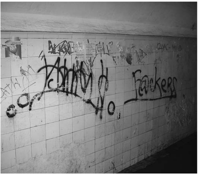
В подземном переходе