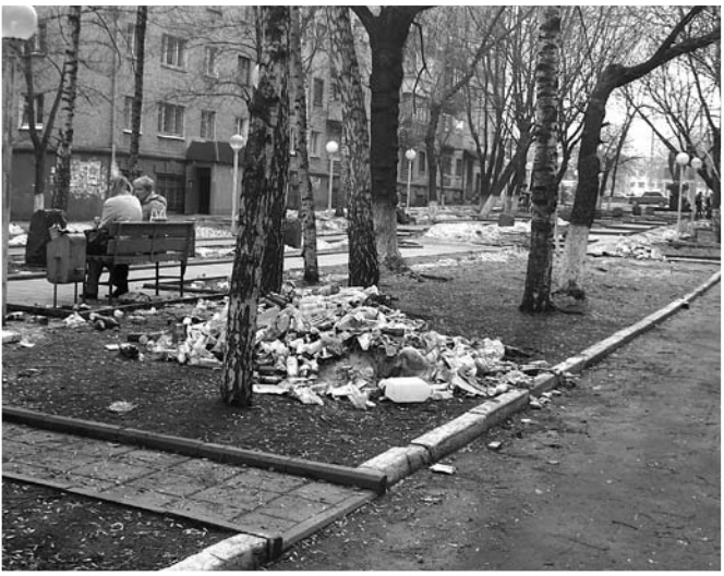
Ул. Куракинская, Аллея памяти