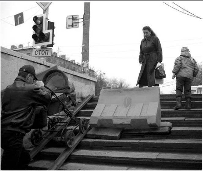
Подземный переход на Октябрьском проспекте