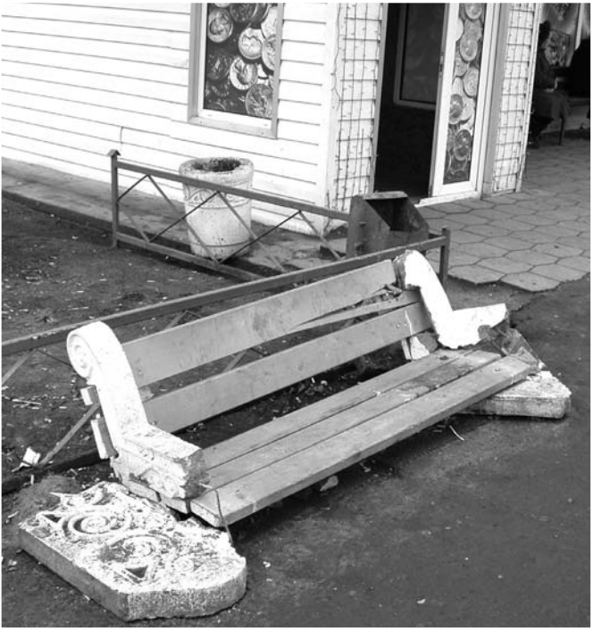
Автобусная остановка «Гастроном»