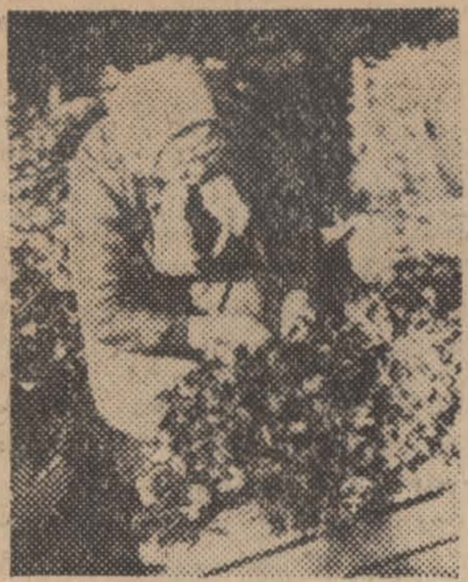
На снимке: в теплице совхоза «Марфино».