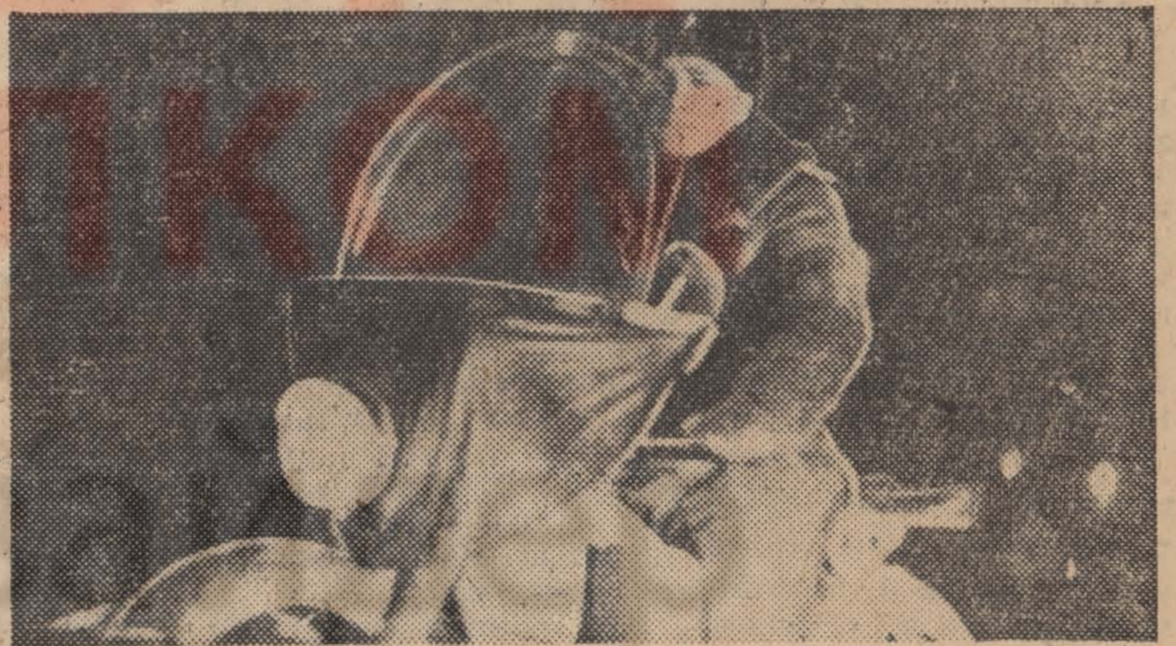
На снимке: моторизованный патруль.