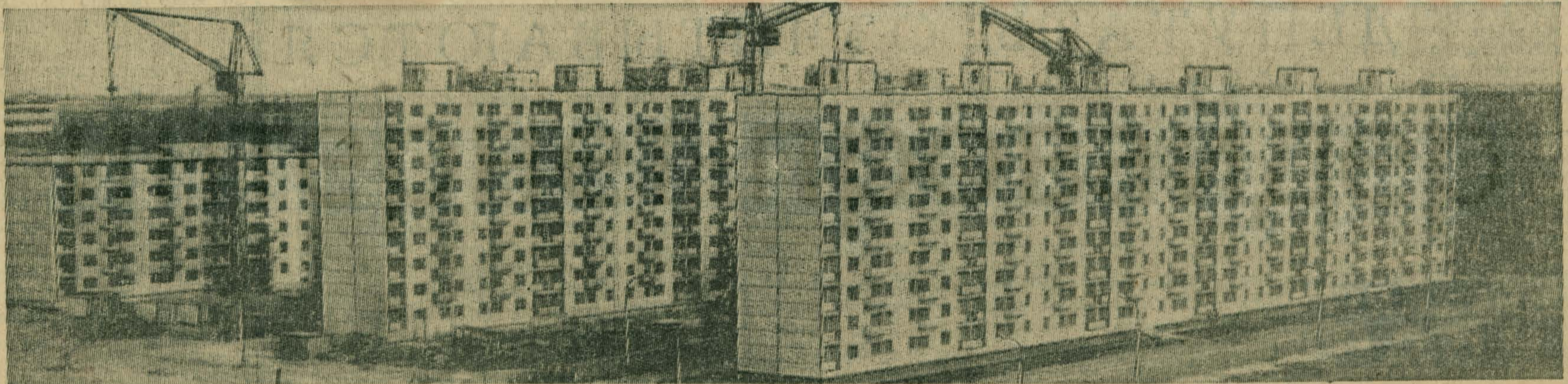
Фото Г. СКОРОХОДОВА.