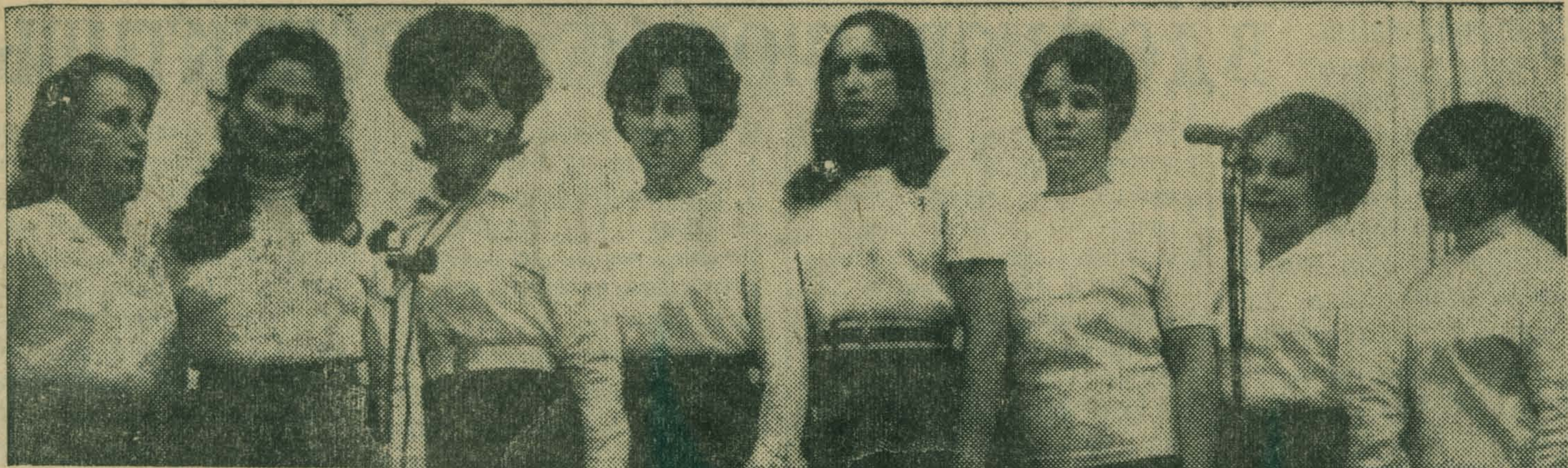
Знакомьтесь: вокальный женский ансамбль.

Эти симпатичные девушки трудятся на Люберецком ковровом комбинате, делают красочные ковры.