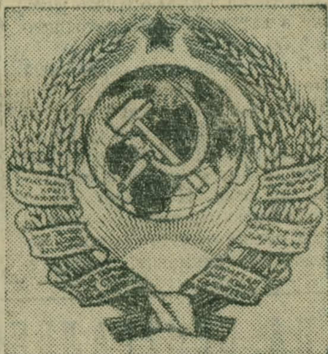
Герб Союза Советских Социалистических Республик, утвержденный 2-й сессией Центрального Исполнительного Комитета Союза Советских Социалистических Республик 6 июля 1923 года в Москве.

Вспомним как это было... Немногие, оставшиеся в живых участники I Всесоюзного съезда Советов, рассказывают о Москве тех дней, особенно об одном из них, когда 30 декабря 1922 года они пришли в Большой те-