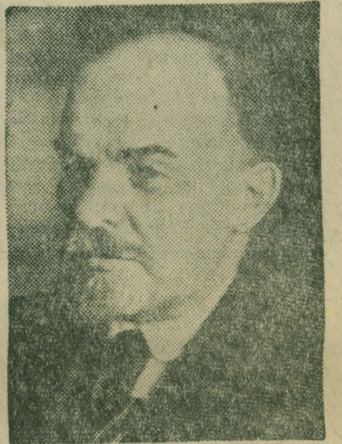
В. И. Ленин. Москва, 4 октября 1922 года.

Завоевание СССР — это и взаимная радость при подведении итогов успешного развития братских республик, и взаимная помощь, сотрудничество. Выступая на торжественном заседании в Тбилиси, посвященном 50-летию Грузинской ССР, Генеральный секретарь ЦК КПСС товарищ Л. И. Брежнев говорил: «Все мы, в какой бы республике мы ни