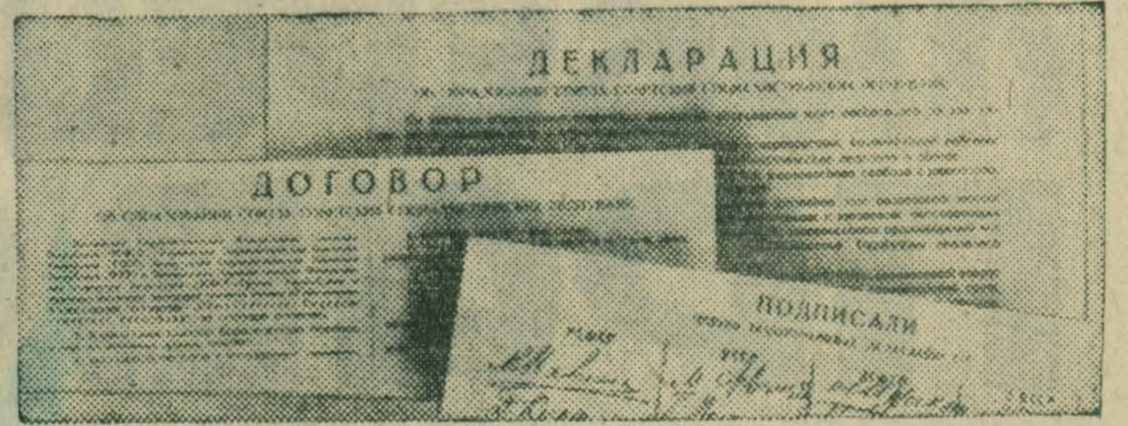
Декларация и Договор об образовании Союза Советских Социалистических Республик, подписанные 30 декабря 1922 года членами полномочных делегаций четырех советских республик.

Вся работа I Всесоюзного съезда Советов, принятые этим историческим съездом документы и решения были воплощением указаний Владимира Ильича Ленина, пронизаны его идеей равноправия и братского сотруд-