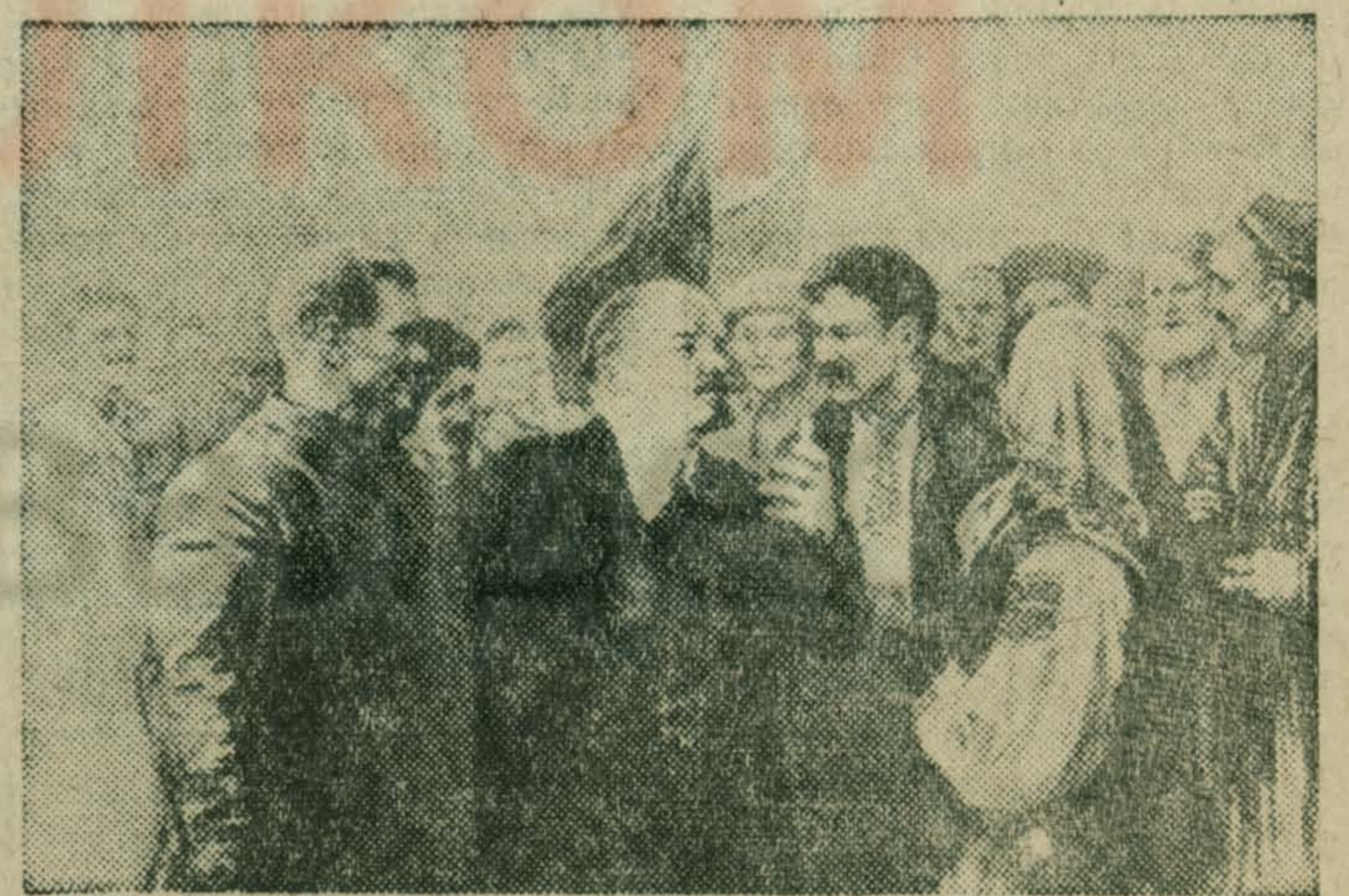
«В. И. Ленин — вдохновитель дружбы народов».

Ленинские принципы организации многонационального Советского социалистического государства проверены временем. СССР ныне является могучим оплотом мира, демократии и социализма. Историей и развитием великого Союза человечеству указан верный путь объединения народов в единую братскую семью, шагающую в коммунистическое завтра.