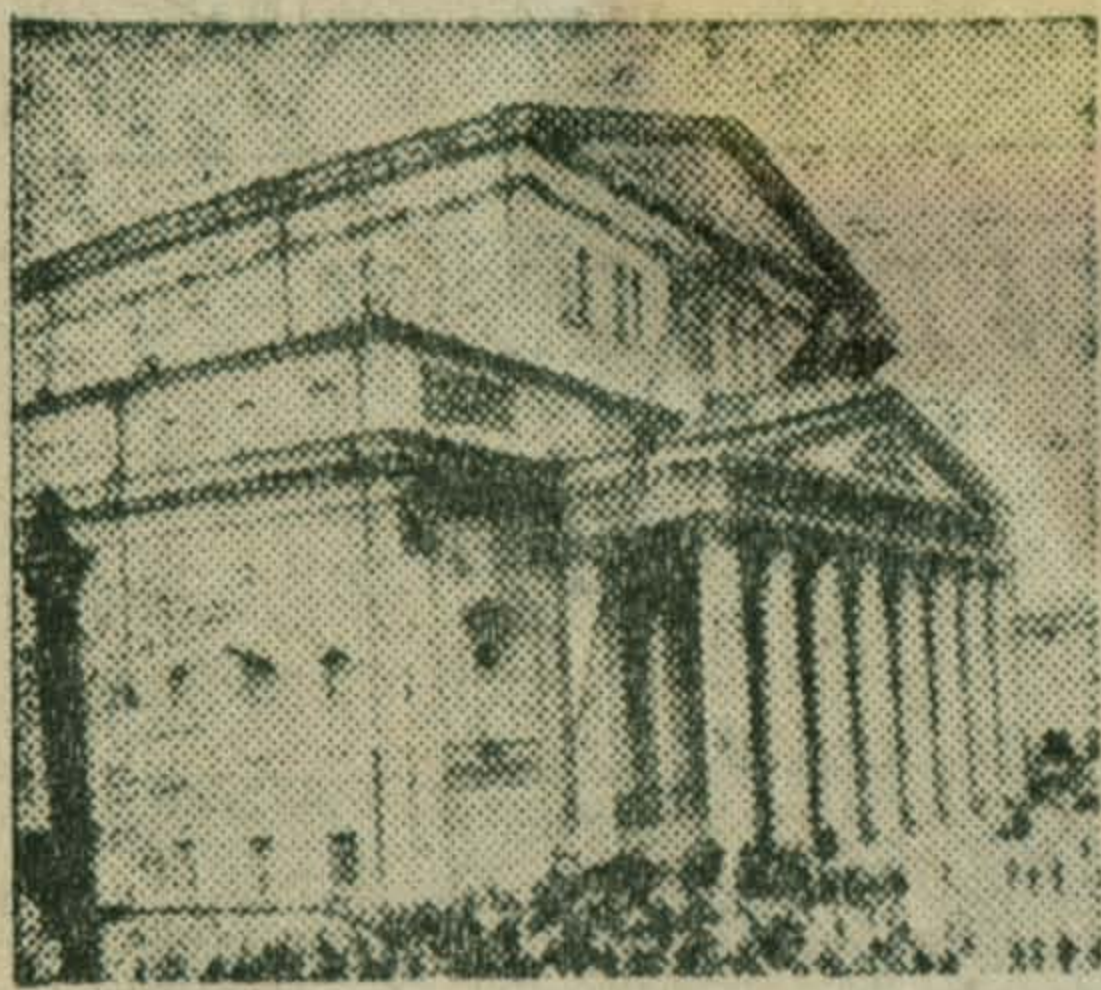
Москва. Вид Большого театра. Здесь в декабре 1922 года проходил I-й Всесоюзный съезд Советов.

В этом зале музея, основная тема которого — В. И. Ленин — создатель Союза Советских Социалистических Республик, — можно ознакомиться с документа-