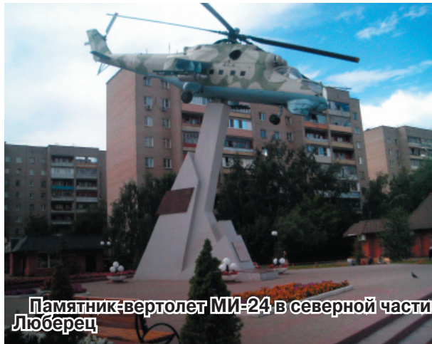
Памятник-вертолет МИ-24 в северной части Люберец