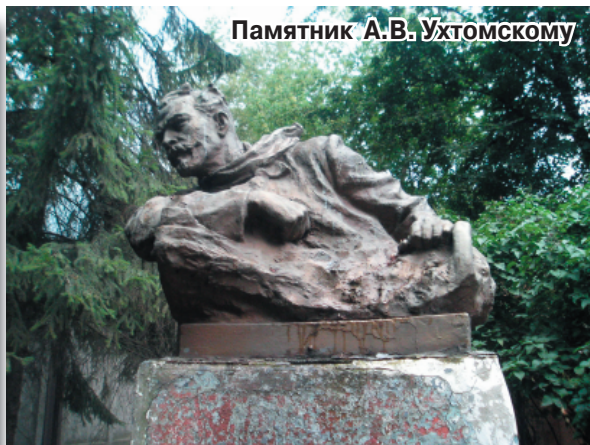
Памятник А.В. Ухтомскому

Наш город, так уж сложилось, небогат историческими памятниками. А те, что есть, постепенно приходят в упадок. Пусть их пока немного, но они являются своеобразным лицом нашего города, рассказывают о его славной истории и его замечательных людях, поэтому достойны уважительного и бережного отношения. Уверены, что со временем на улицах города вырастут новые монументы, современные архитектурные ансамбли. А пока мы должны бережно ухаживать за тем, что уже у нас есть. На опубликованных фотографиях памятники известные и не очень, есть даже позабытые. Может быть, стоит отправиться на прогулку по местам нашей славы, взять с собой детей и внуков, рассказать им о тех, чьим трудом или подвигом создавались Люберцы?