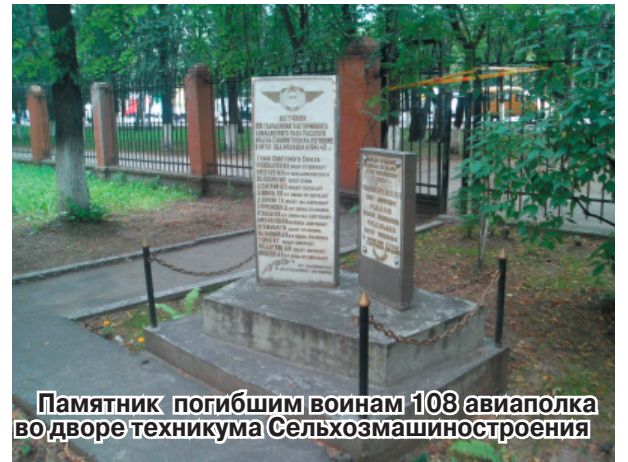
Памятник погибшим воинам 108 авиаполка во дворе техникума Сельхозмашиностроения