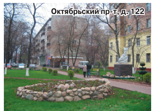
Октябрьский пр-т, д. 122

езжали к самым окнам. Но жаль, что не отремонтировали дорогу у соседнего дома – № 10. Там тротуар по-прежнему разбит, а рытины после дождя наполняются водой, образуя лужи. Этот контраст – между территориями возле нашего дома и соседним – всем бросается в глаза. Надо все привести в порядок и там».