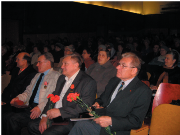
27 октября в Доме культуры имени Ухтомского состоялась торжественная встреча, посвященная 90-летию ВЛКСМ. Здесь собрались люберчане-комсомольцы разных лет.

Всесоюзный Ленинский Коммунистический Союз Молодежи почти ровесник Страны Советов. Поэтому и разделил все трудности и беды, выпавшие на его долю, принял участие во всех героических свершениях, ознаменовавших становление великой страны.