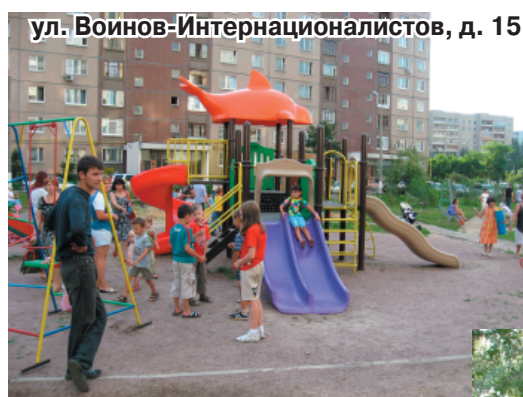
ул. Воинов-Интернационалистов, д. 15

наших дворах по предложению городских депутатов уже установлено 20 (16 – детских и 4 – спортивных) площадок, изготовленных по последнему слову техники, ярких, современных, удобных и безопасных. Приятно сознавать, что детворе теперь есть где гулять, а подросткам – заниматься физкультурой и спортом. Конечно, для такого городского поселения, как Люберцы, и этого количества площадок недостаточно. Но ведь мы находимся только в начале выполнения комплексной программы благоустройства. Поэтому в данное время устанавливаются еще три площадки: две детские и одна спортивная, и мы собираемся продолжить эту работу в дальнейшем».