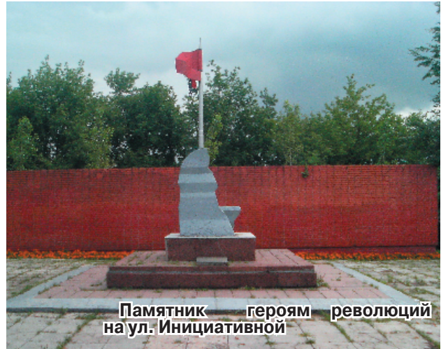
Памятник героям революций на ул. Инициативной