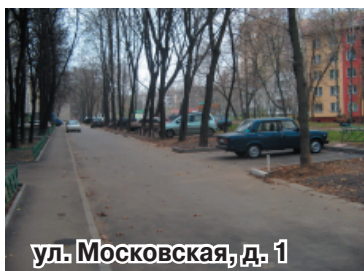
ул. Московская, д. 1

В городе полным ходом идет ремонт дорог и тротуаров, расположенных в непосредственной близости от жилых домов, чему способствует нынешняя теплая, почти без дождей, осень.