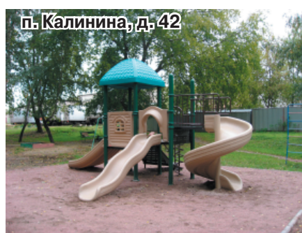
п. Калинина, д. 42