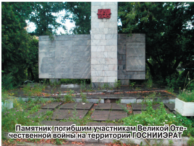
Памятник погибшим участникам Великой Отечественной войны на территории ГОСНИИЭРАТ