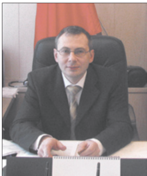
Продолжение. Начало на странице 1.

Победы для всех был настоящим праздником. Но и создать этот памятник мы должны все вместе – и с представителями бизнеса, и со всеми жителями Красково.