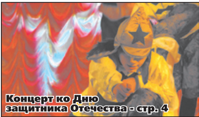
Концерт ко Дню защитника Отечества - стр. 4