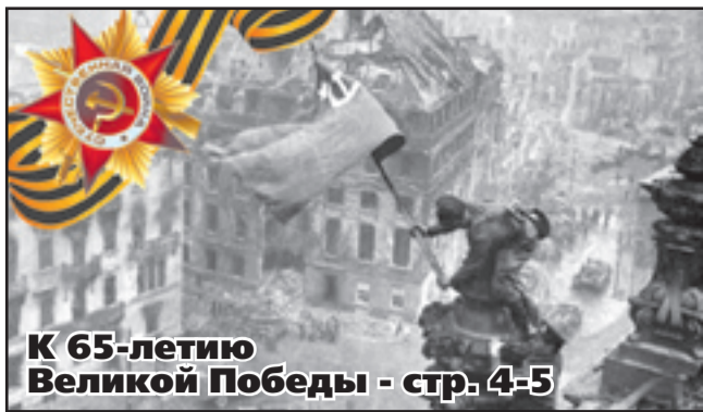
К 65-летию Великой Победы - стр. 4-5