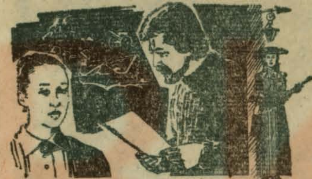
ГОРОДА И ГОДЫ

СМОТРИТЕ В КИНОТЕАТРЕ «ОРБИТА» новый фильм