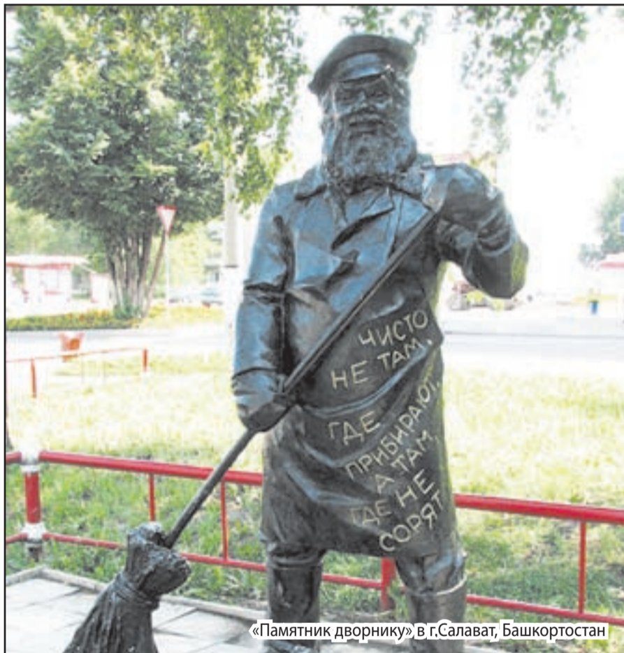
«Памятник дворнику» в г.Салават, Башкортостан