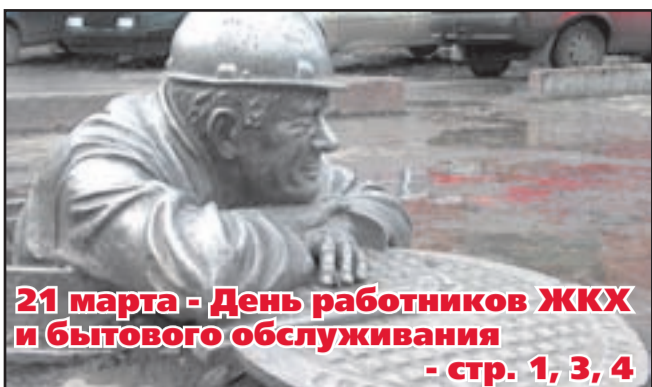
21 марта - День работников ЖКХ и бытового обслуживания - стр. 1, 3, 4