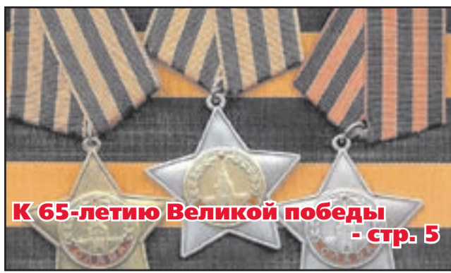
К 65-летию Великой победы - стр. 5