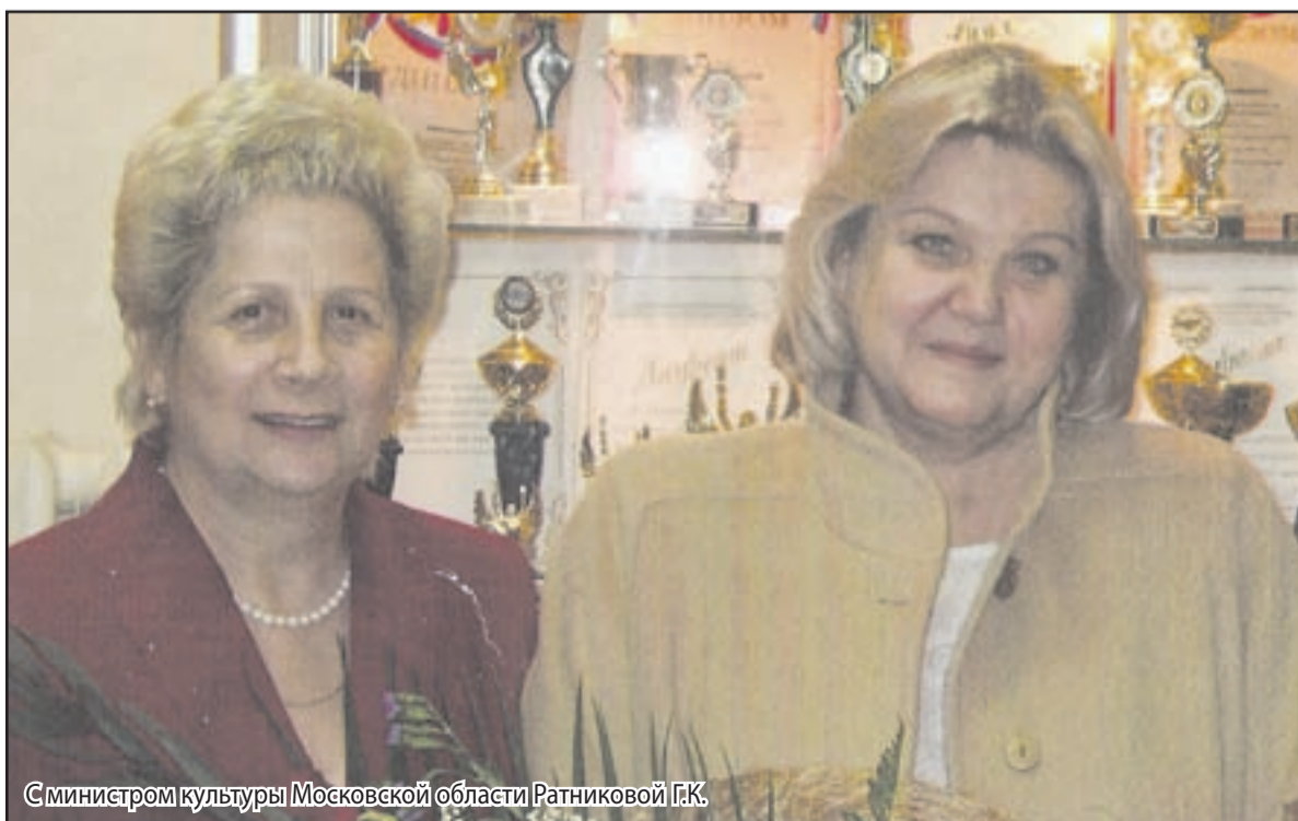
С министром культуры Московской области Ратниковой Г.К.