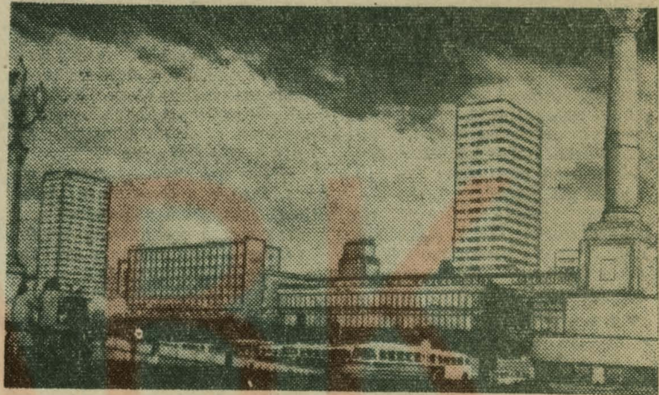
Варшава. Многоэтажные башни современных зданий, красивые павильоны центральных магазинов построены сейчас на Маршалковской улице. Эта центральная магистраль города протянулась на несколько километров, прямая, просторная, всегда оживленная.