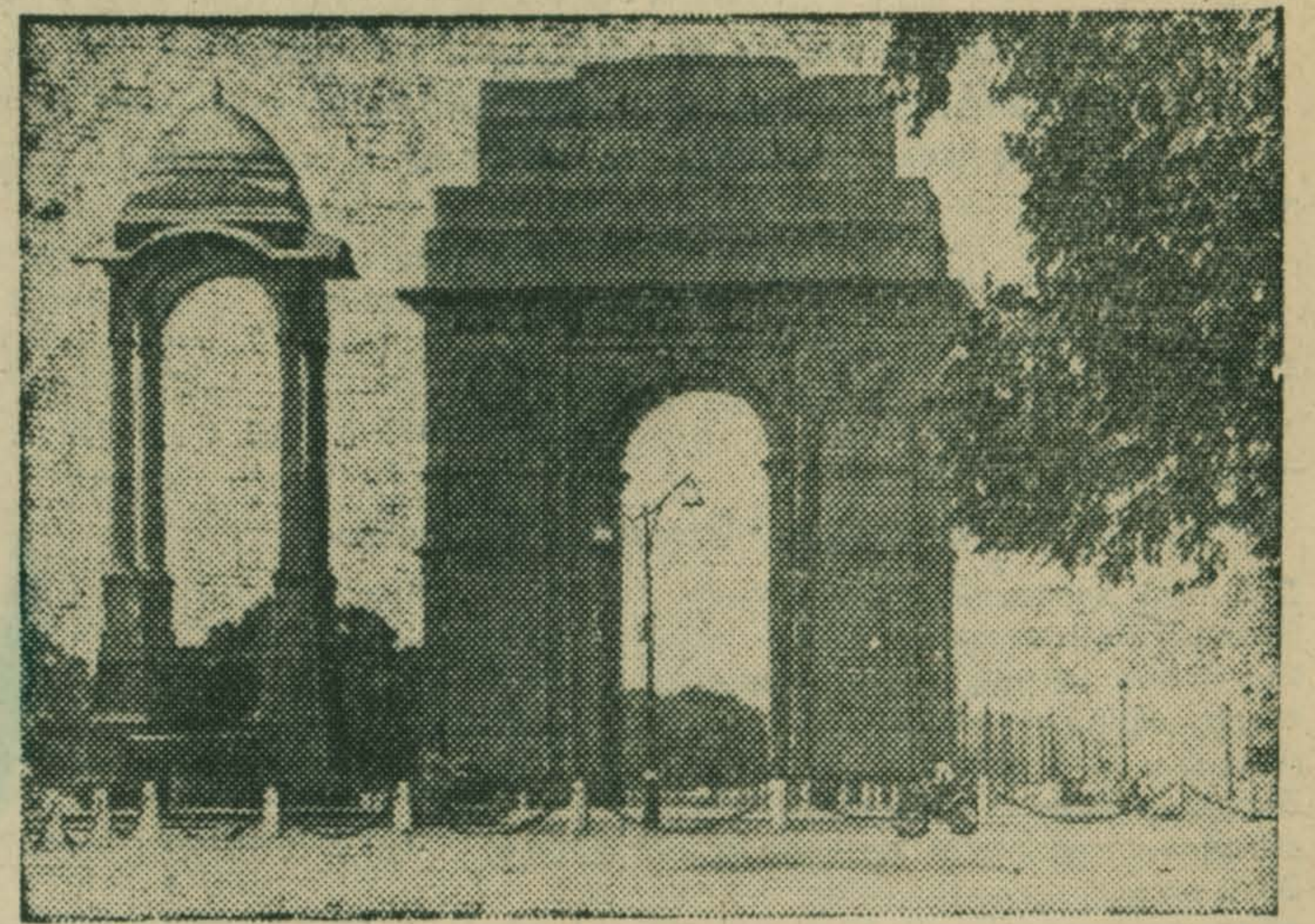
«Ворота Индии» в Дели.

26 ЯНВАРЯ ИСПОЛНИЛОСЬ 25 ПЕТ СО ДНЯ ПРОВОЗГЛАШЕНИЯ (1950) РЕСПУБЛИКИ ИНДИИ