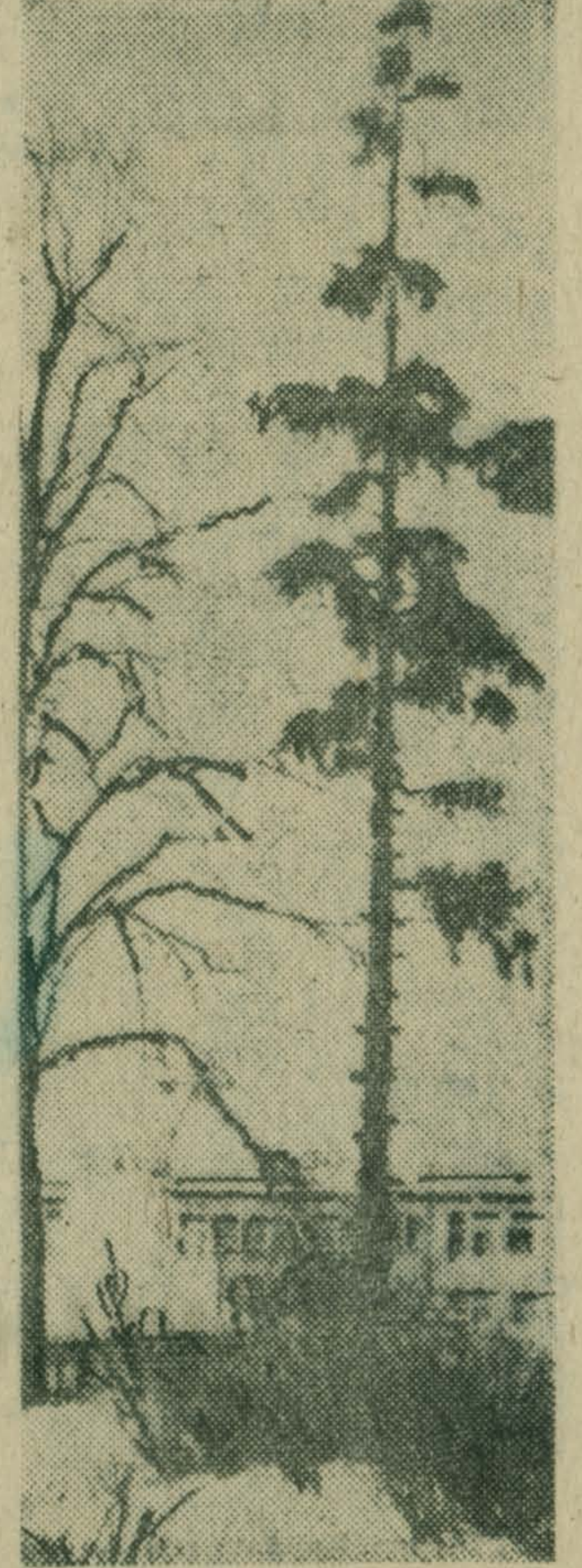
...Смотрит в небо.