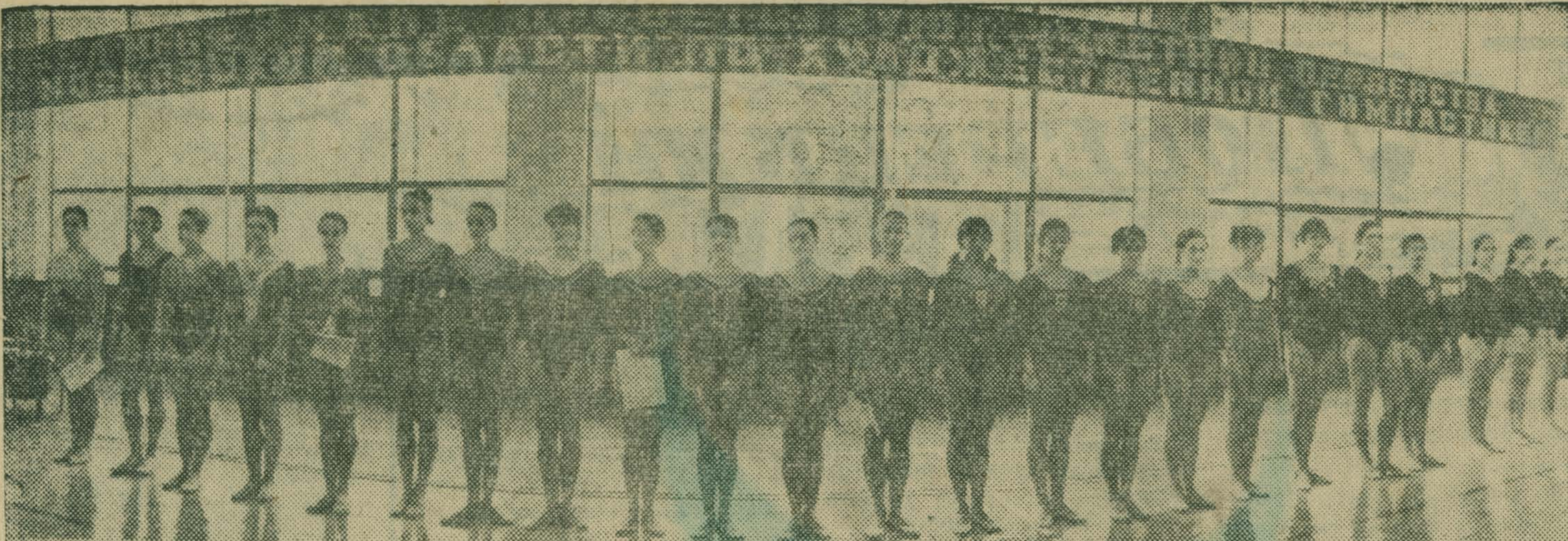
Парад участниц соревнований.