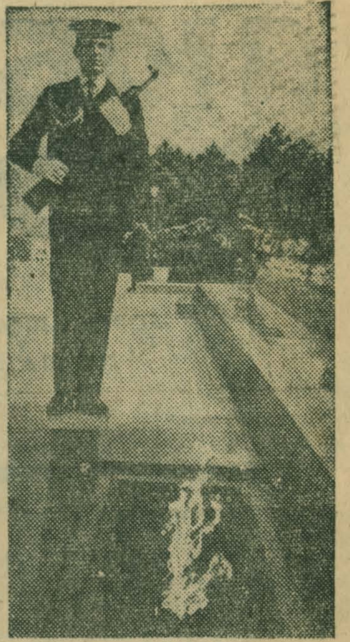
Севастополь. У Вечного огня на Сапун-горе, зажженного в честь освободителей города.

Делегаты приняли социалистические обязательства новаторов района на 1975 год.