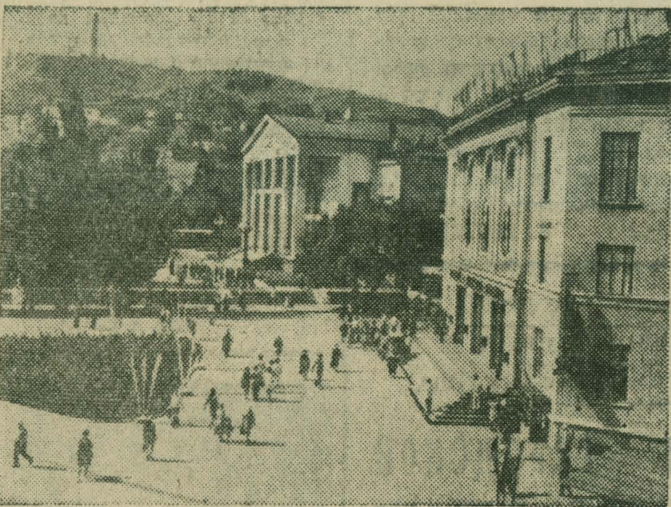
Керчь. Площадь имени В. И. Ленина.