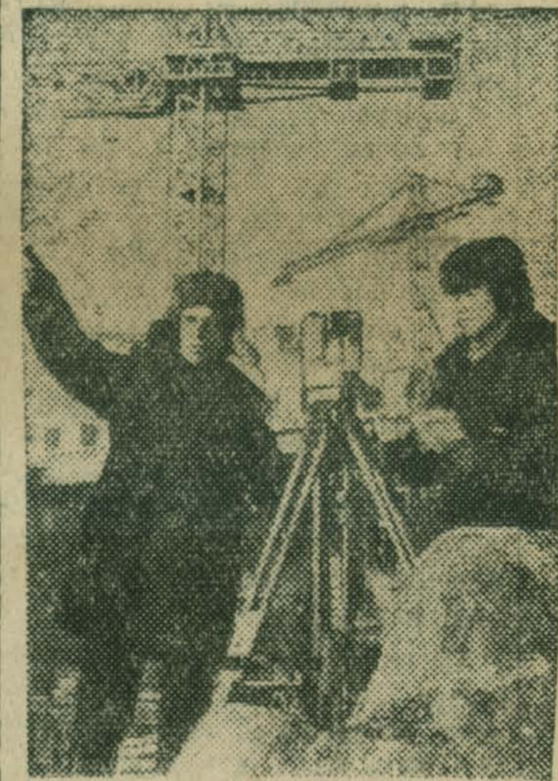
АМУРСКАЯ ОБЛАСТЬ. На Всесоюзной ударной комсомольской стройке — Зейской ГЭС полным ходом идут монтажные и бетонноукладочные работы.

В ноябре этого года строителям предстоит сдать в промышленную эксплуатацию первый агрегат мощностью 215 тысяч киловатт.