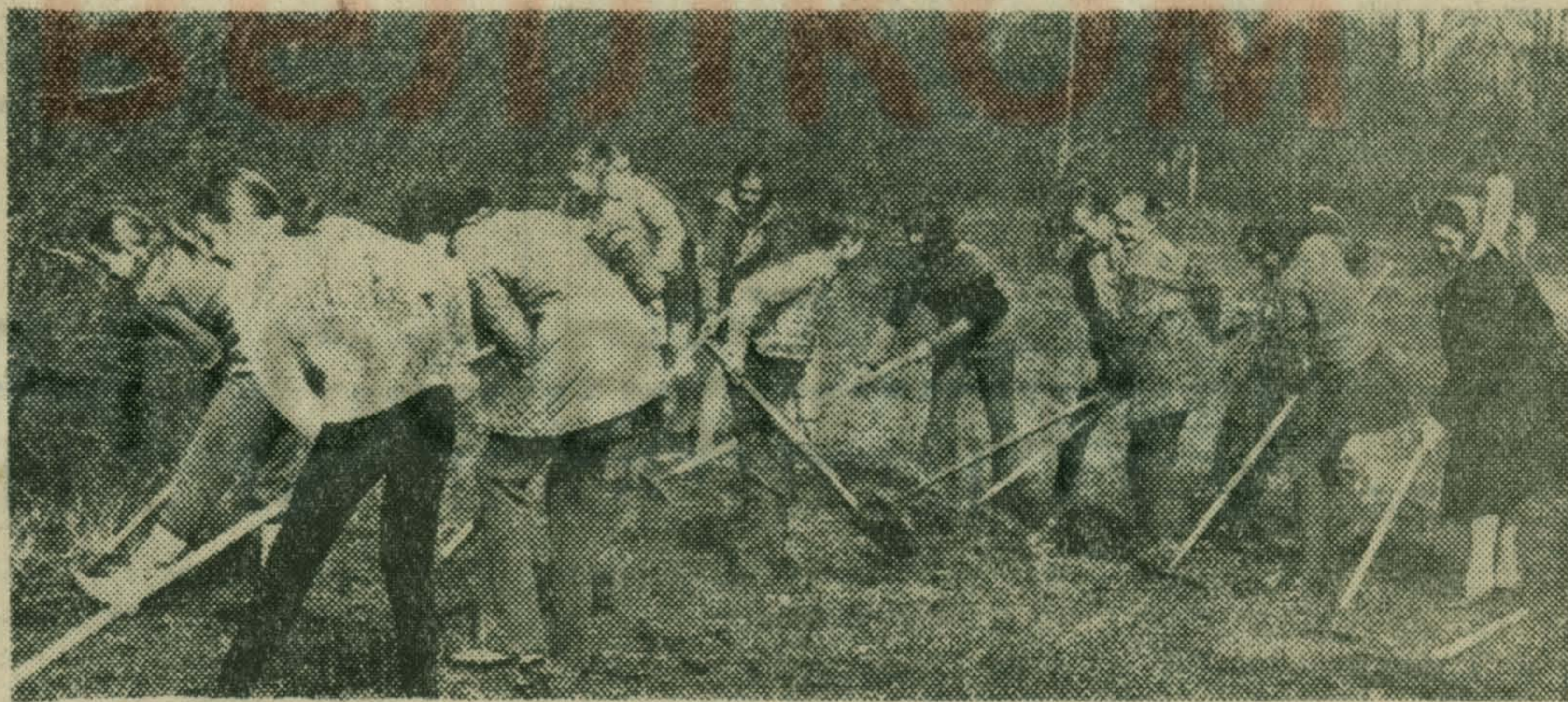
НА СНИМКЕ: субботник учащихся 24-й косинской школы.

СТРОКОВА, ОКУНЕВА, КИСЛЫХ, КРАСНОВ — всего 34 подписи.